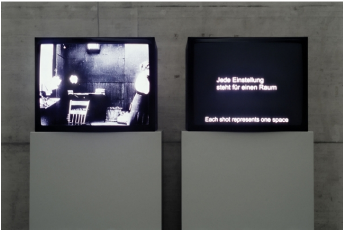
Installation view: Kino wie noch nie, 2006. Generali Foundation.