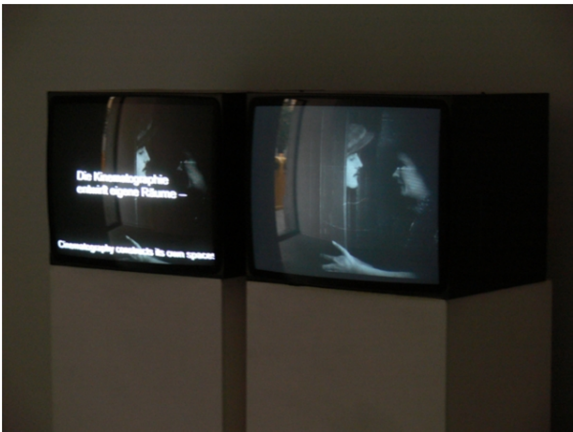
Installation view: àngels barcelona, 2007.