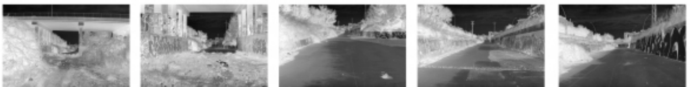
Descendiendo el lecho de la riera. Detalle de la secuencia de diapositivas del proyector #3