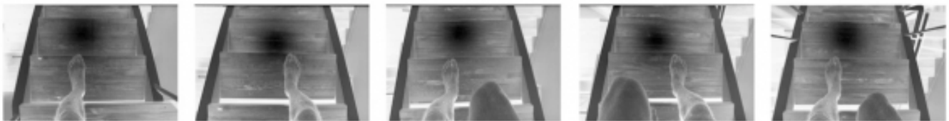
Pies descalzos bajando la escalera. Detalle de la secuencia de diapositivas del proyector #2