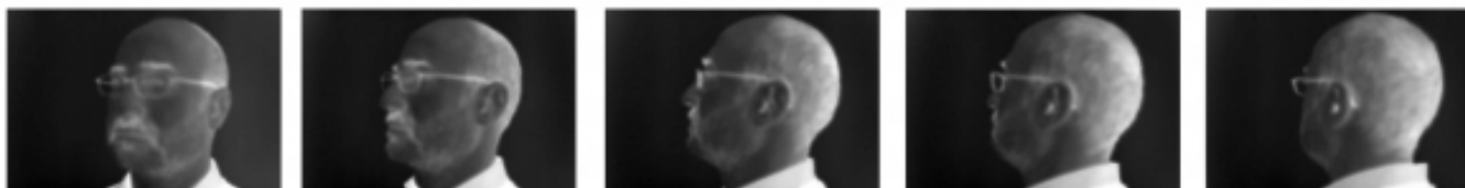
Autorretrato rotatorio. Detalle de la secuencia de diapositivas del proyector #5