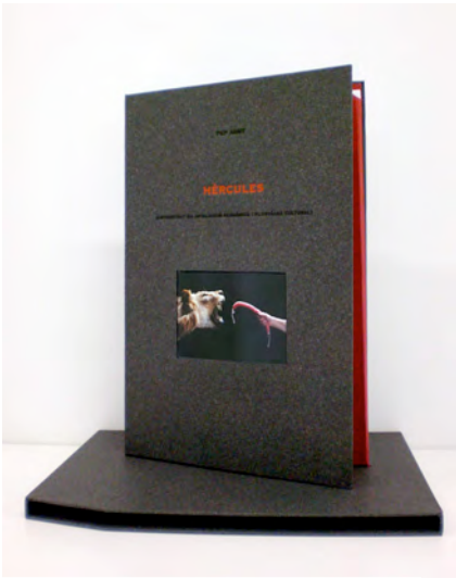
Contract's folder and cover / Carpeta y tapa del contrato