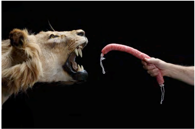
Colour photograph at the cover of the contract. 10 x 6.5 cm / Fotografía a color en la tapa del contrato. 10 x 6,5 cm