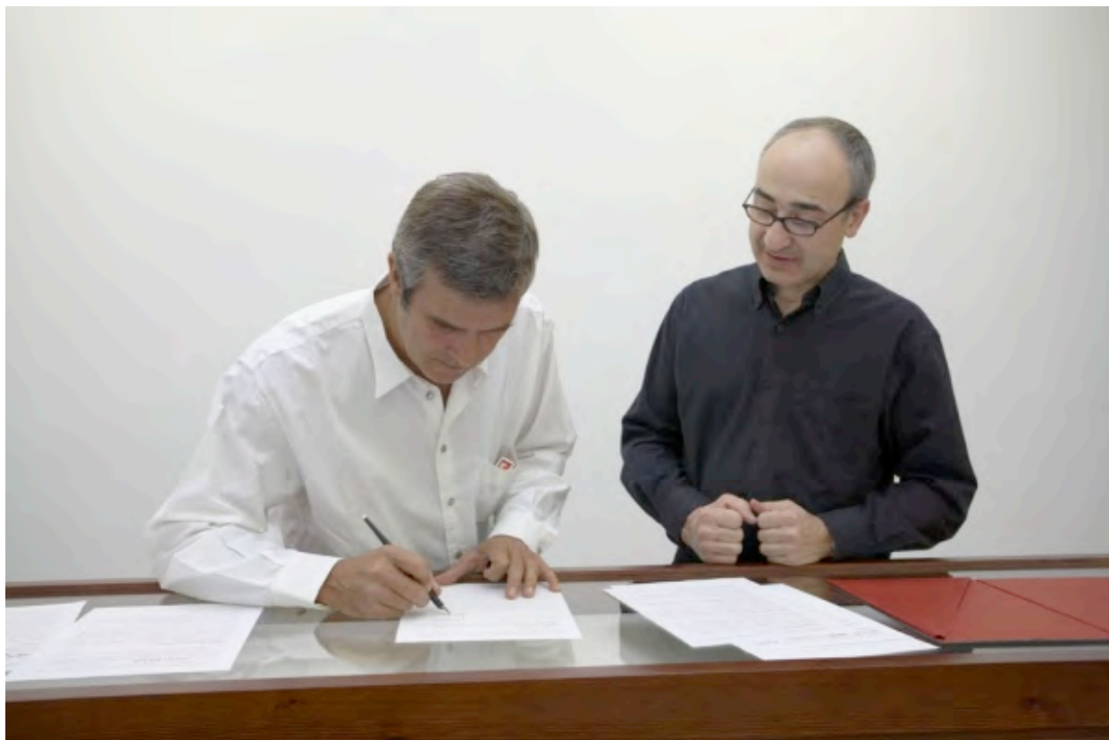
Signature of the first contract / Firma del primer contrato