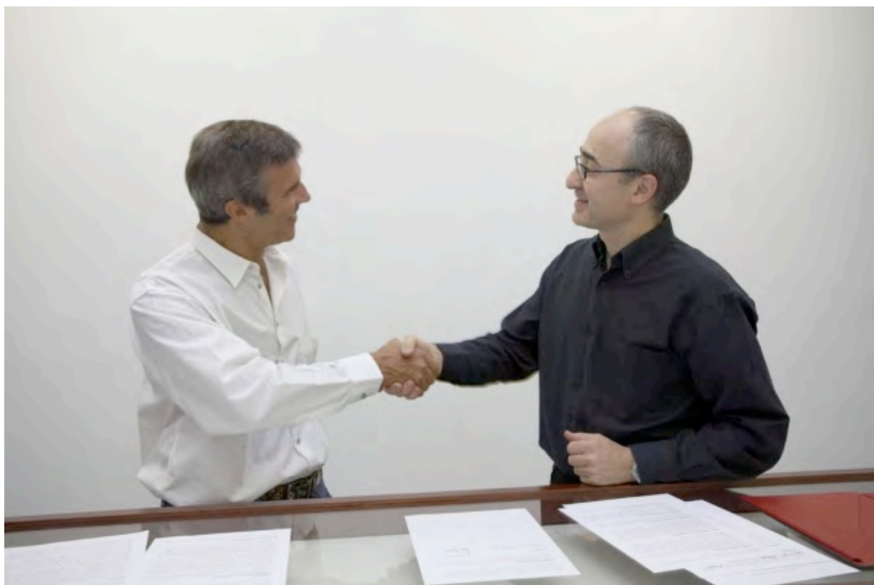
Signature of the first contract / Firma del primer contrato