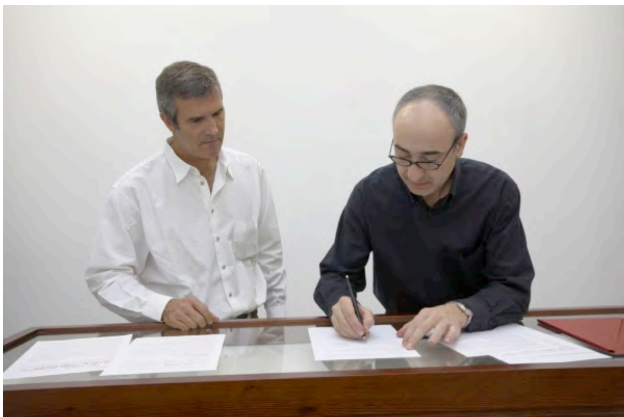
Signature of the first contract / Firma del primer contrato