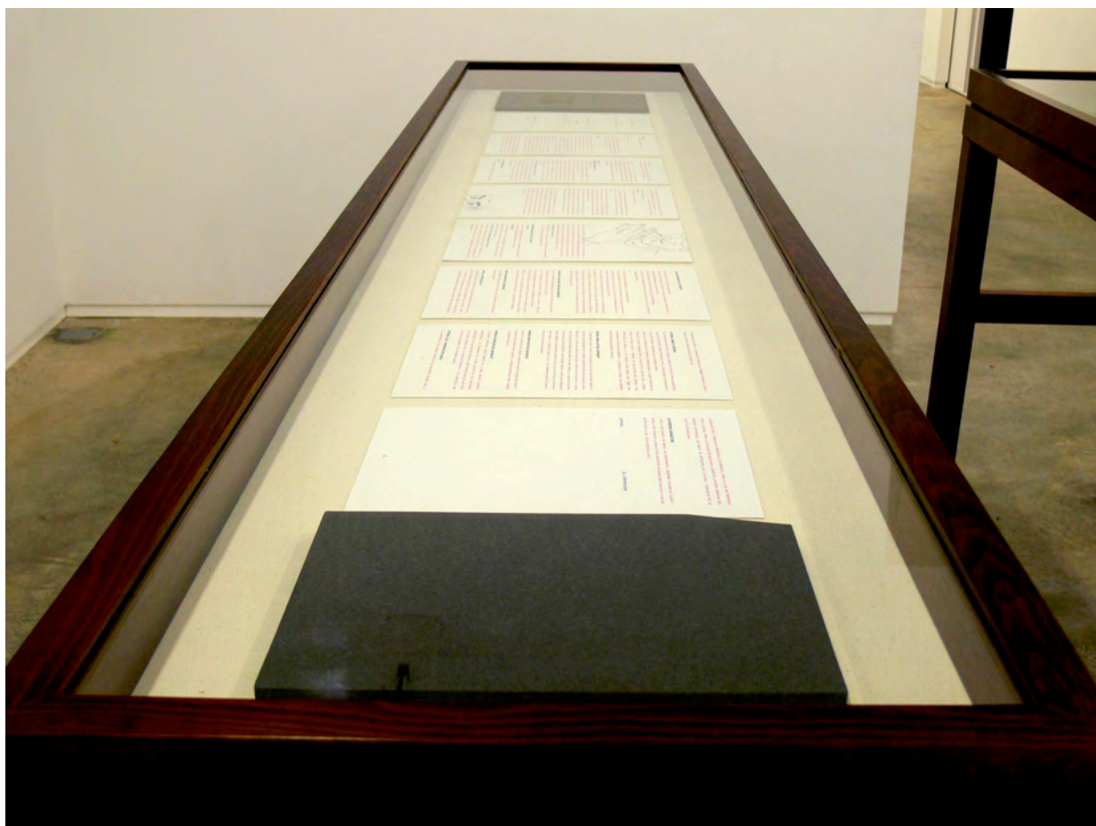
View of the contract in its display case / Vista del contrato en su vitrina