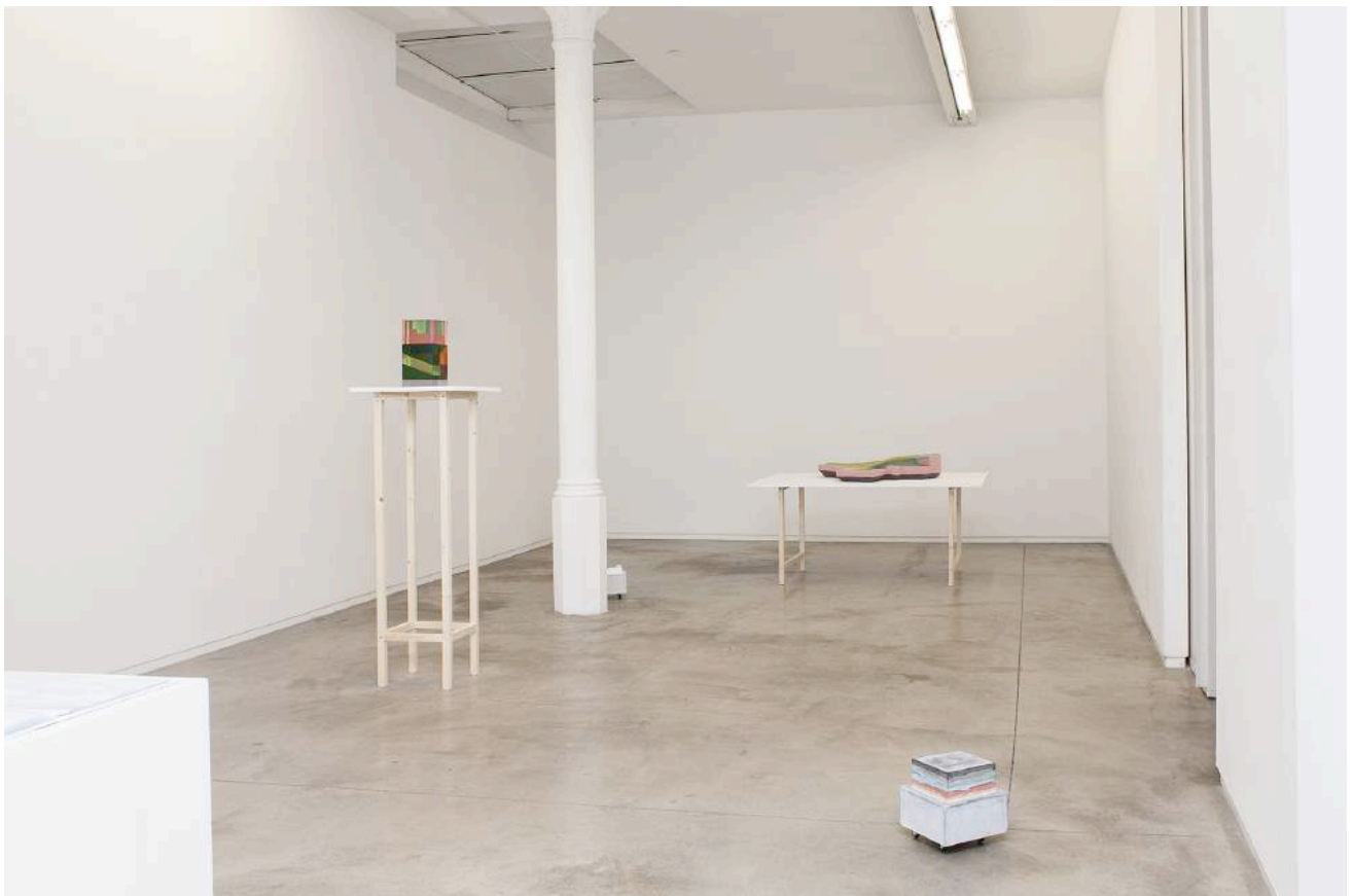
Vistas exposición àngels barcelona, 2017. Exhibition views àngels barcelona, 2017.