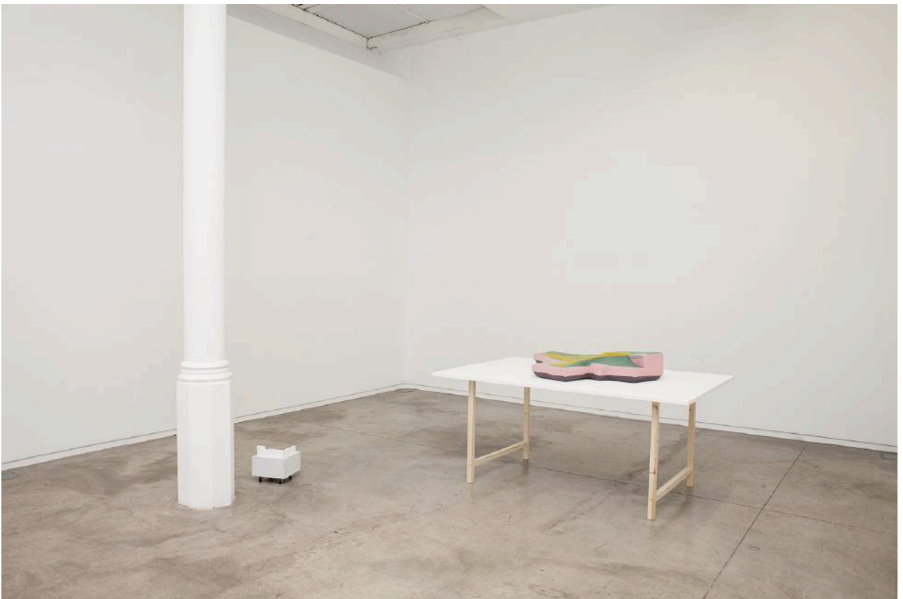
Vistas exposición àngels barcelona, 2017. Exhibition views àngels barcelona, 2017.