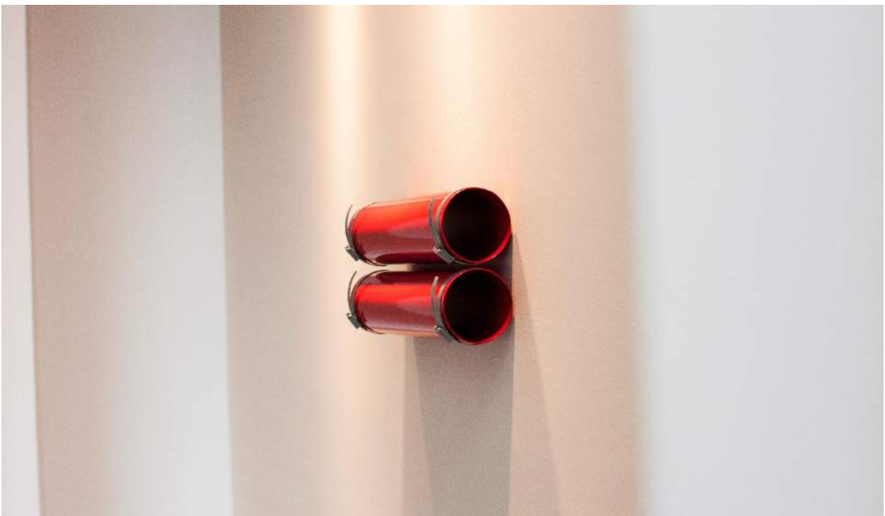
TGWNDOHM – ( labios ), 2018. Vista detallada de la exposición en àngels barcelona. Tubo de metal pintado de rojo x 2, abrazaderas, 21,5 x 40 x 10 cm, Único TGWNDOHM ( lips ), 2018. Detailed view from the exhibition at àngels barcelona, Metal tube painted in red x 2, brackets, 21,5 x 40 x 10 cm, Unique