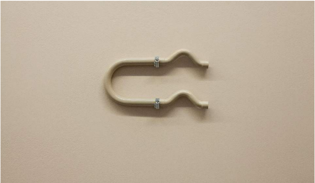
TGWNDOHM ( Tubo #3 ), 2018. Vista detallada de la exposición en àngels barcelona. Tubo de metal pintado, 27 x 16 cm, Único TGWNDOHM ( Tubo #3 ), 2018. Detailed view from the exhibition at àngels barcelona, Painted metal tube, 27 x 16 cm, Unique

Con este proyecto Lúa Coderch prosigue con una manera de trabajar en la que el papel de la investigación le hace explorar la superficie de las cosas y la materialidad de las narrativas personales e históricas. Para ello, utiliza una amplia gama de medios y estrategias con las que pone en relación objetos, anécdotas, voces y todo un territorio de signos que afectan al espectador a través de la atención, el accidente, el entusiasmo, la sinceridad, o el desengaño, y así despertar en el público una reacción empática a través de la cual poder imaginar su obra como un lugar de encuentro.