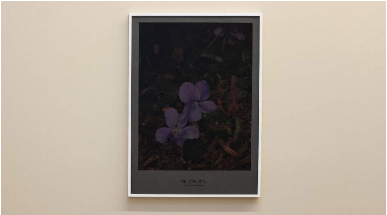
Sore throat 10% darker (We can still) , 2018. Vista detallada de la exposició en àngels barcelona. Fotografia color. Impresió digital a color enmarcada, cristal tintado, 70 x 50 cm, Ed. 3 + audio vinilo "We can still be Friends" (2018), 18'