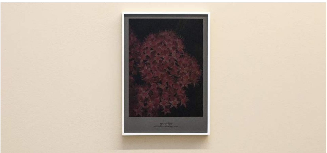
Sore throat 10% darker (Remember) , 2018. Vista detallada de la exposició en àngels barcelona. Fotografia color. Impresió digital a color enmarcada, cristall tintat, 40 x 30 cm, Ed. 3 + àudio vinil "We can still be Friends" (2018), 18'

The Girl With No Door On Her Mouth refers to the lack of criteria, the verbal incontinence and the possibility, or the inability, to speak sincerely and meaningfully for others. For this Coderch resorts to concatenations of tubes, simulating a phonation device that can only emit an inarticulate sound -not yet a word- a collection of cushions dyed with the technique of tie- dye (2) as silences or capitulations, a plant collection used to treat mouth and throat illnesses, a stage from which to speak or listen, a series in the process of banal and worn discourses recorded on vinyl and a video that takes as a starting point the mouth piece Not I (3) , by Samuel Beckett.