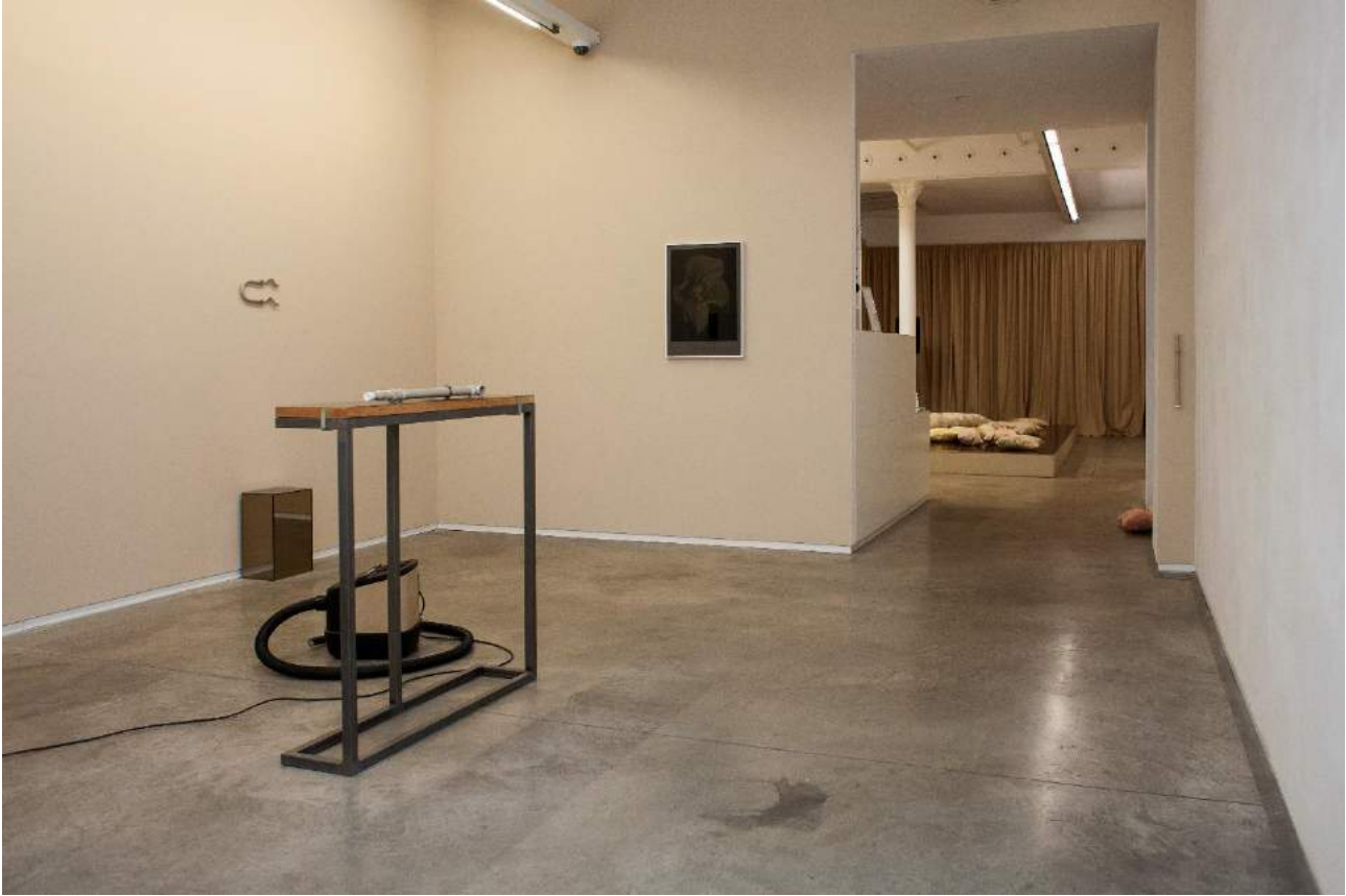
Vista general de la exposición "The Girl With No Door on Her Mouth" en àngels barcelona. Barcelona, 2018.