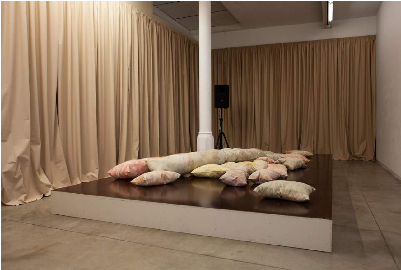
The courage of shutting up , 2018. Vista de la instalación en àngels barcelona. 35 cojines de algodón teñidos con la técnica tie-dye con un verso, 41 x 27 cm (c/u)