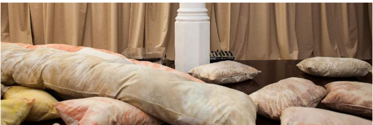
Vista detallada de la instalación The courage of shutting up , 2018.

The Girl With No Door On Her Mouth se refiere a la falta de criterio, a la incontinencia verbal y a la posibilidad o imposibilidad de hablar sinceramente y con sentido para los demás. Para ello Coderch recurre a concatenaciones de tubos, simulando un aparato de fonación que solamente puede emitir un sonido inarticulado —todavía no una palabra— una colección de cojines teñidos con la técnica de tie-dye (2) a modo de silencios o capitulaciones, un herbario de plantas, que sirven para tratar afecciones en la boca y en la garganta, un escenario desde el que hablar o escuchar, una serie en proceso de discursos banales y gastados grabados en vinilo y un vídeo que toma como punto de partida la pieza para boca Not I (3), de Samuel Beckett.