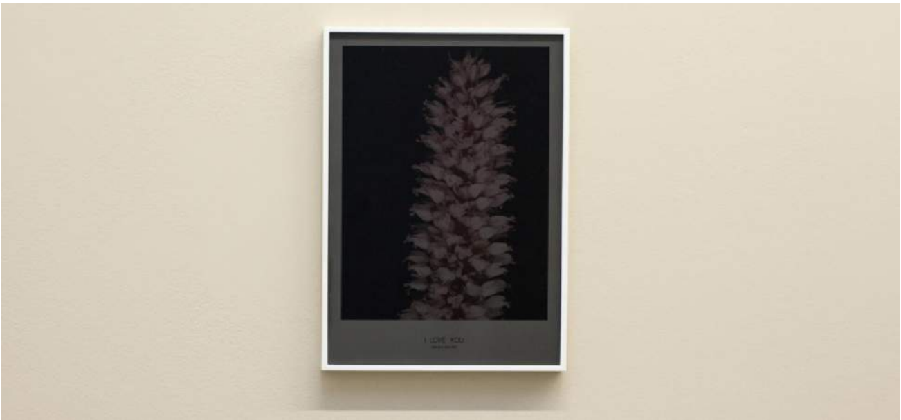
Sore throat 10% darker (I love you) , 2018. Vista detallada de la exposició en àngels barcelona. Fotografia color. Impresió digital a color enmarcada, cristall tintat, 40 x 30 cm, Ed. 3 + àudio vinil "We can still be Friends" (2018), 18'