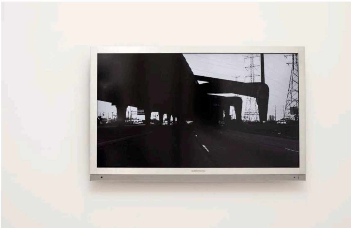
Word String # 15, 2013. Digital animation. 40 sec., Ed 3, + 1 A.P.

Thanks to Macba, Barcelona, who provided the recording logistics