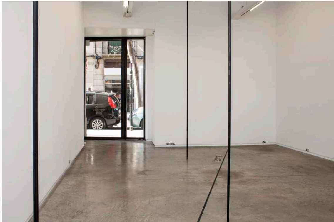
Vista general de la instalación, PLACE, HERE / AND, AS, 2A, THERE, 2019

El trabajo de Peter Downsbrough (1940, New Brunswick, New Jersey, EEUU) se distingue por un uso riguroso, escaso, si no estrictamente limitado, de formas geométricas primarias como líneas, cuadrados y cuadrículas, signos de puntuación aislados (puntos, corchetes abiertos y cerrados) y palabras como adverbios (here, there), conjunciones (and) o preposiciones (as, to), fragmentos de mapas y planos de planta, que interactúan en varias constelaciones y medios (instalaciones, dibujos, collages, postales, fotografías, esculturas, y especialmente libros de artista, vídeos, música y piezas de sonido). Comunmente asociado con contemporáneos del movimiento de arte conceptual de la década de 1970 como Robert Barry, Sol LeWitt o Lawrence Weiner, esta es la cuarta exposición individual de Downsbrough en angels barcelona desde el 2008 (con una pieza de sala y piezas de pared), en 2011 (con dibujos y piezas de pared) y en el 2015 (con fotografías).