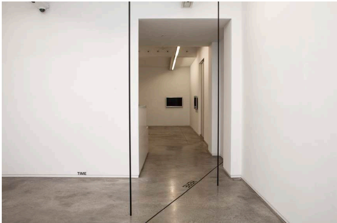
Vista general de la instalación, PLACE, HERE / AND, AS, 2A, THERE, 2019

Después de sus dos primeros libros, Notes on Location y Notes on Location II (1972, resp. 1973), publicó sucesivamente varios libros que se basaban enteramente en esa "firma": Two Lines, Six Sections (1973), Two Lines, Five Sections (1974 and 1975), Two Lines, Two Lines (1976), así como publicaciones en las que combinó Two Lines con palabras en In Front y In/Out (1975, o con fotografías en Beside (1976), y la serie en curso A Place___ (desde 1977).