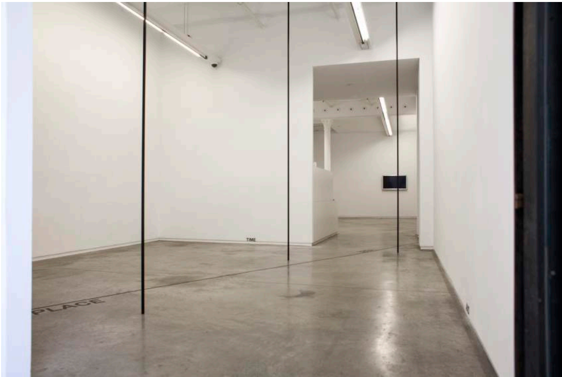
Installation view PLACE, HERE / AND, AS, 2A, THERE, 2019

Two Lines is a formal arrangement of two vertical lines, 0,5 cm apart from each other and 6.3 cm long lines, for which the artist has made originally two rubber stamps: one of two parallel lines, one of a single line. These lines, simple but compelling, occupy an entire page and most important, provide structure and define space. Coincided with the sculptural thesis, the so-called Two Pipes , the lines changed over time their size and proportion and appeared as well on postcards and together with other elements (grids, words, photographs and films). In short: Two Lines embody as a metaphysical concept the very essence of Downsbrough's oeuvre, forming its linear and persistent pace.