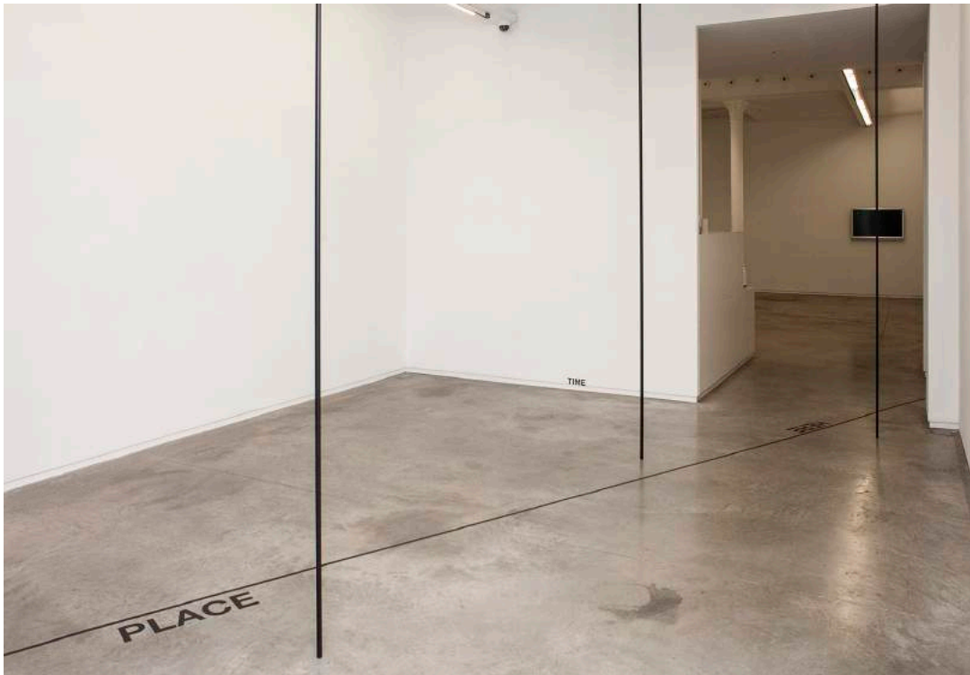
Installation view PLACE, HERE / AND, AS, 2A, THERE, 2019

Peter Downsbrough's (1940, New Brunswick, New Jersey / US) body of work distinguishes itself by a rigorous, sparse if not strictly limited use of primary geometrical forms as lines, squares and grids, isolated punctuation marks (dots, open and closed brackets) and words such as adverbs (here, there), conjunctions (and) or prepositions (as, to), fragments of maps and floor plans, that all interact in various constellations and media (installations, drawings, collages, post cards, photographs, sculptures, and notably artists' books, videos, music and sound pieces). Frequently associated with contemporaries of the 1970s conceptual art movement as Robert Barry, Sol LeWitt or Lawrence Weiner, it is Downsbrough's 4 th solo exhibition at àngels barcelona after 2008 (with a room piece and wall pieces), 2011 (with drawings and wall pieces) and 2015 (with photographs).