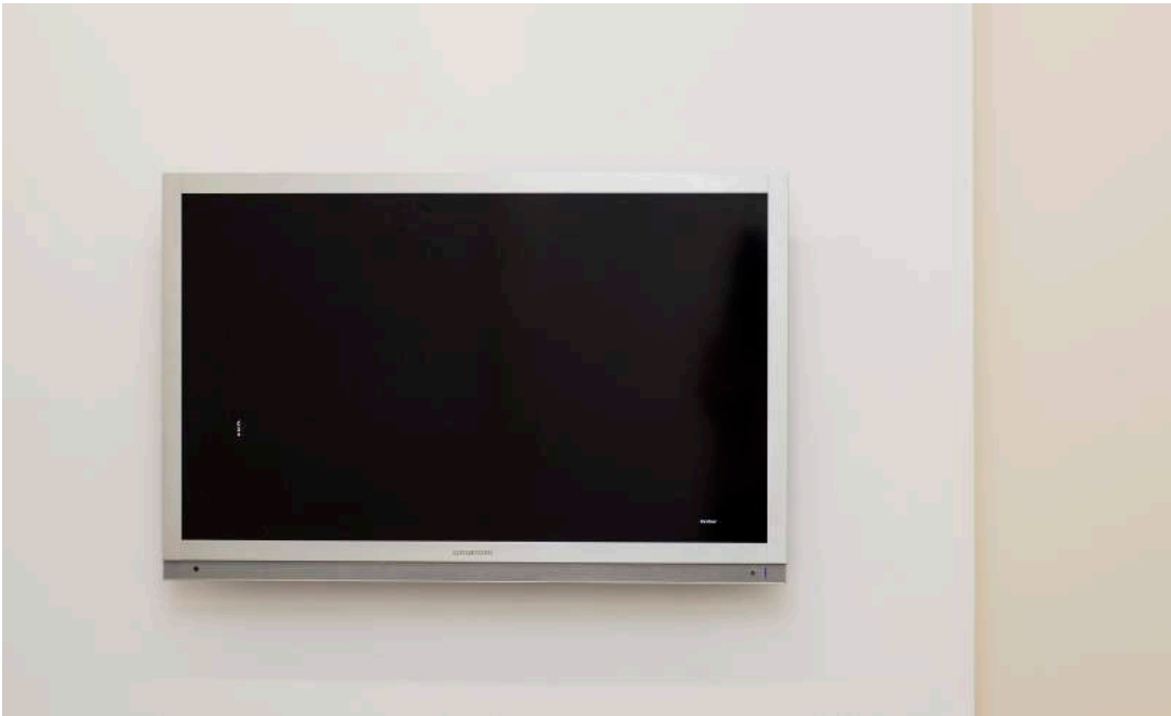
Word String #21, 2013. Digital animation. 57 sec., Ed 3, + 1 A.P.

Notably, the invitation card of àngels barcelona depicts Two Lines . Again, the lines are parallel, but instead equal in length, they measure 75 and 12 mm and it will be for the very first time that the artist adapted them on an announcement in this particular constellation / composition. As such, they suggest a perspective, in my view a 'wall' seen from a side with an imaginary vanishing point. That very same work is installed too on the gallery's front window, joined by the word BUT, set in Helvetica adhesive letters. BUT [Two Lines] (2019) alludes somehow an altered, yet expanded reality: an imagined perspective and a real one that continues inside the gallery. The room piece (2019) that occupies the entire front space consists of the words PLACE, HERE, AND, AS, 2A, THERE which are placed on the bottom edge of three walls and the floor, completed with three black aluminium pipes suspended from the ceiling. A forth diagonal line on the floor separates 'here' from 'there' and 'place' from the viewers' position, and directs her/him gently to the back space too. In contrast, this second room appears less charged and at first sight rather empty with some animated sequences on monitors from the series Word Strings (2013, ongoing), and the sound piece The List (2019, adapted since 2011).