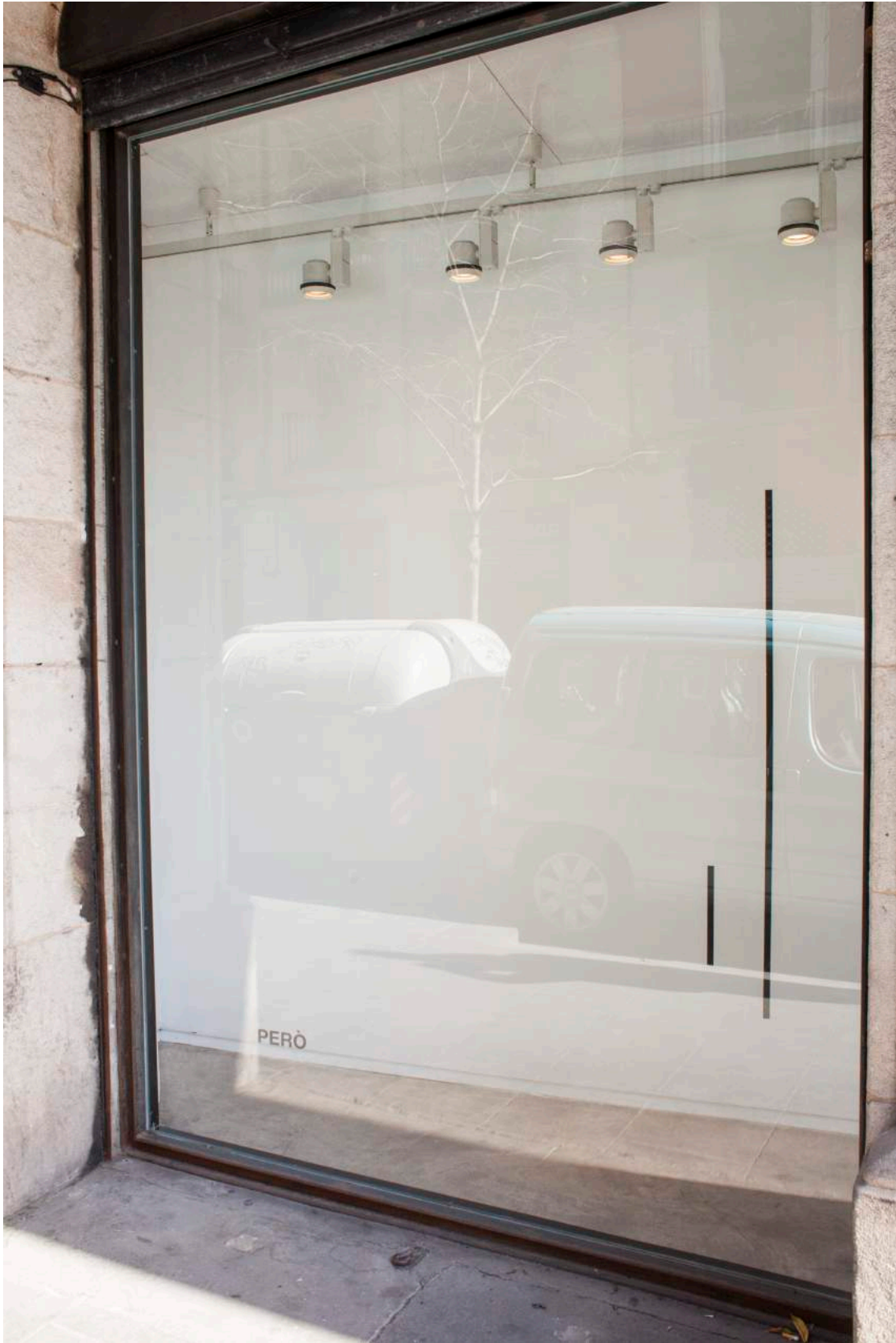
BUT, 2019. Pieza de pared.