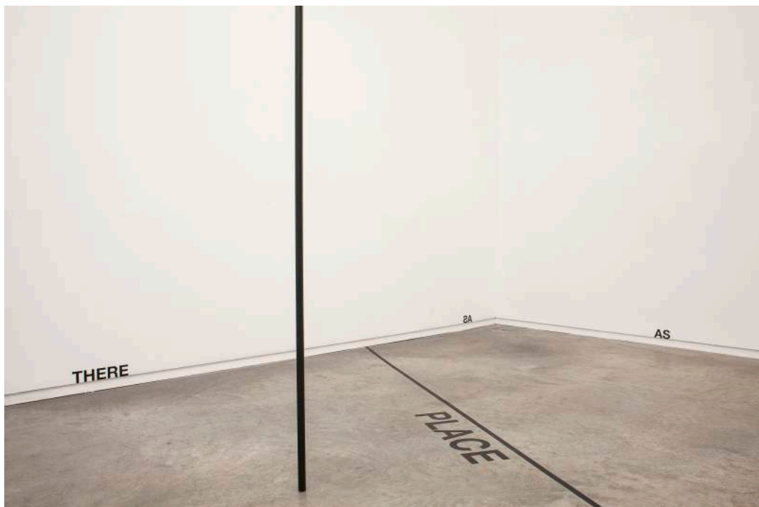
Vista general de la instalación, PLACE, HERE / AND, AS, 2A, THERE, 2019

Two Lines es una disposición formal de dos líneas verticales, separadas 0,5 cm entre sí y 6,3 cm de largo, para las que el artista ha realizado originalmente dos sellos de goma: uno de dos líneas paralelas, uno de una sola línea. Estas líneas, simples pero convincentes, ocupan toda una página y, lo más importante, estructuran y definen el espacio. Coincidiendo con la tesis escultórica, las llamadas Two Pipes , las líneas cambiaron su tamaño y proporción con el tiempo, y también aparecieron en postales, y en otros soportes (cuadrículas, palabras, fotografías y películas). En resumen: Two Lines encarnan como concepto metafísico la esencia misma de la obra de Downsbrough, formando su ritmo lineal y persistente.