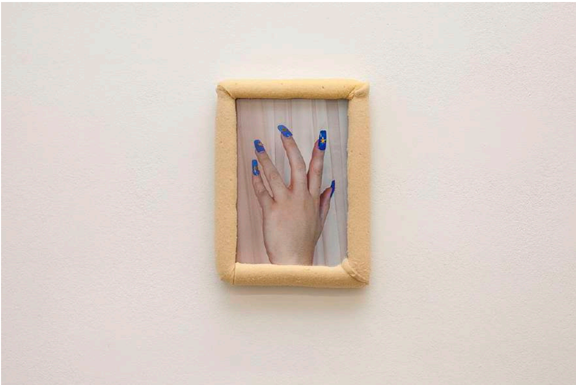
Europa nails (they fall down when you least expect it) , 2019 Fotografía intervenida enmarcada 23 x 33 x 2,5 cm Ed. 3