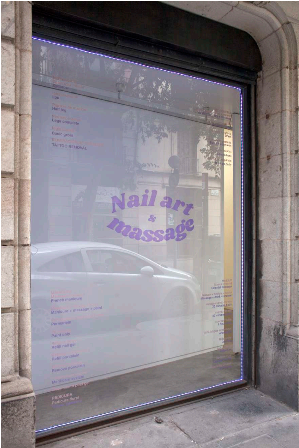
Vista del escaparate de la galería. View of the gallery window