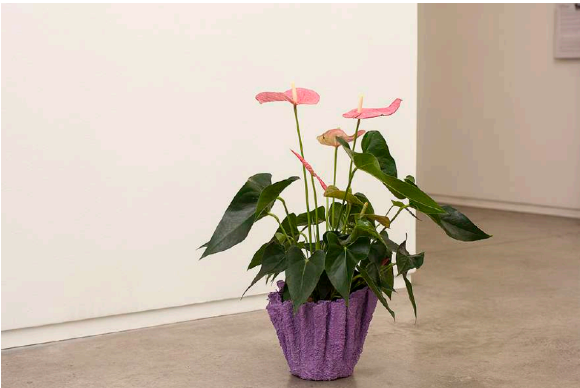
Tattooed plant , 2019 Técnica mixta. Impresiones color sobre hojas de Anturio ( Anthurium Scherzerianum ) Dimensiones variables