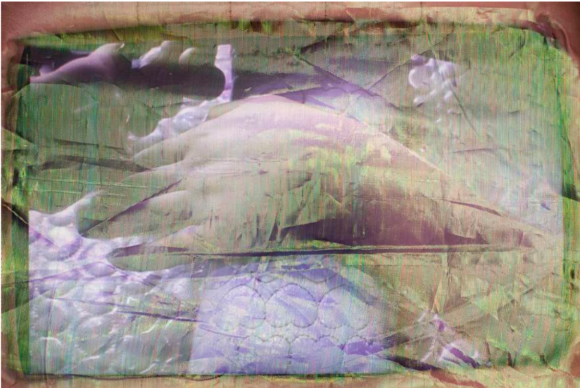
Detail of Perfect Point 2019 Video installation. Mixed technique. Padded armchair with wheels, gauze fabrics, 2 stools Variable dimensions Video, color, sound Unique