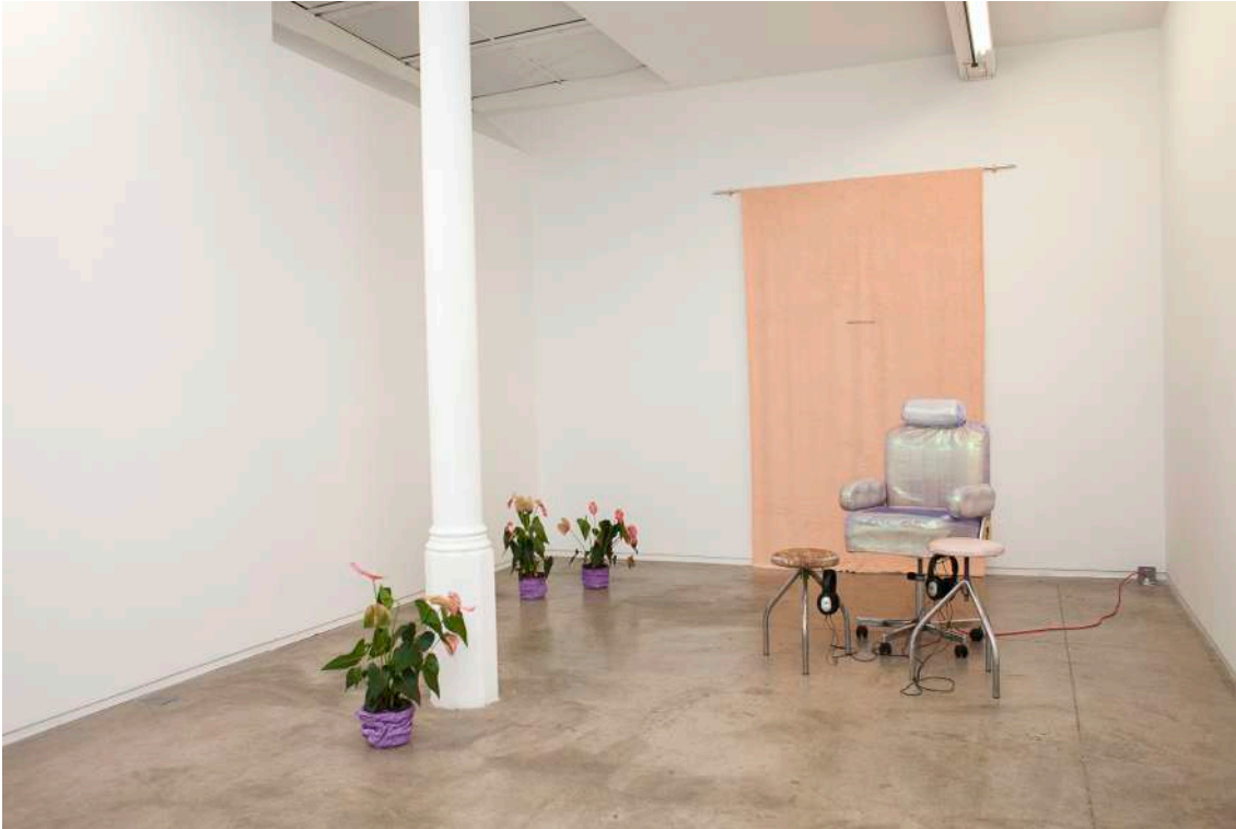
Vista general de la exposición. General exhibition view