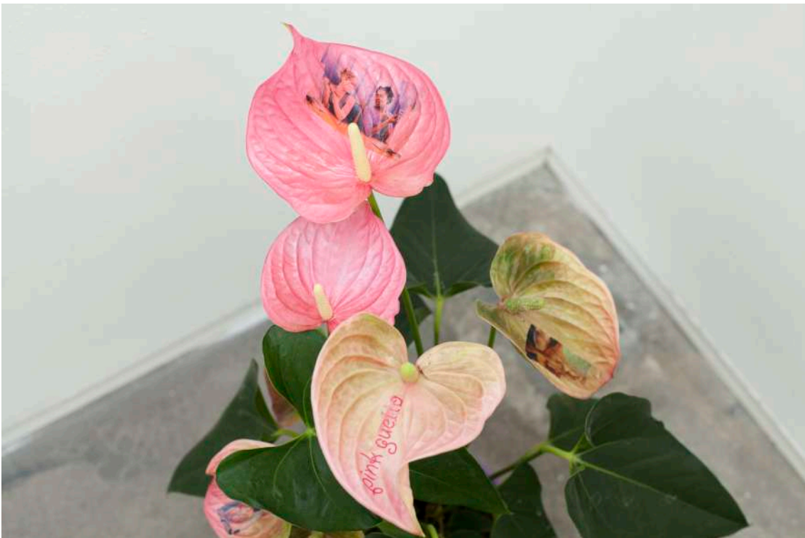
Detail Tattooed plant , 2019 Técnica mixta. Impresiones color sobre hojas de Anturio ( Anthurium Scherzerianum ) Dimensiones variables