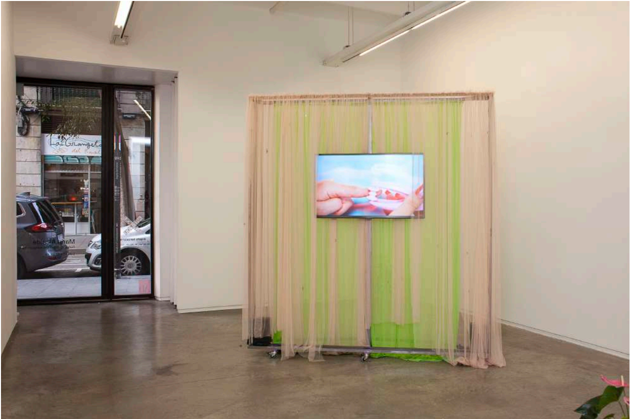
The managed hand 2019