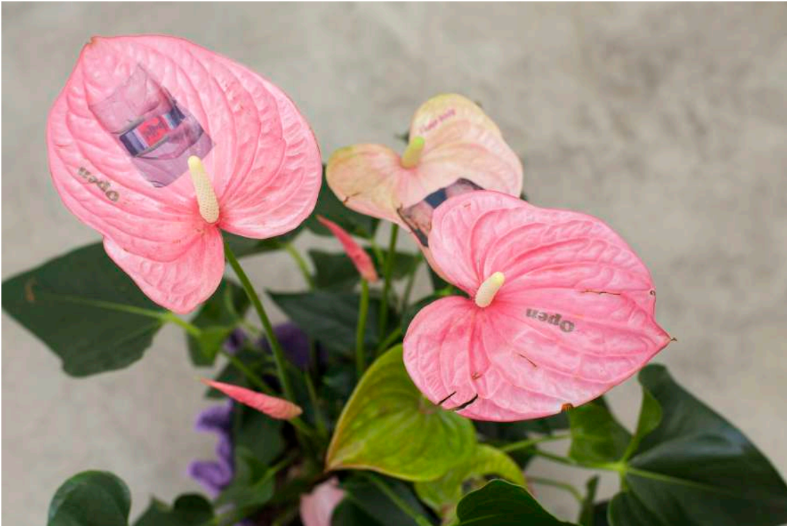
Detail Tattooed plant , 2019 Técnica mixta. Impresiones color sobre hojas de Anturio ( Anthurium Scherzerianum ) Dimensiones variables