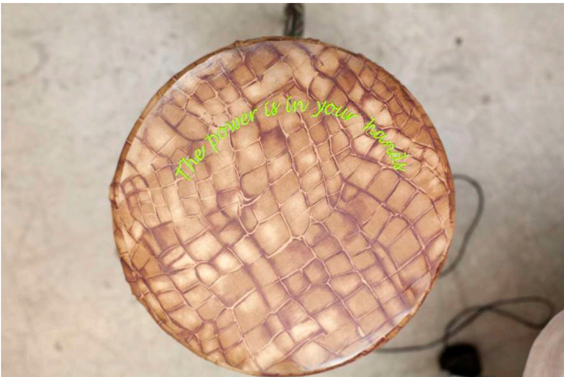
Detail of Perfect Point 2019 Video installation. Mixed technique. Padded armchair with wheels, gauze fabrics, 2 stools Variable dimensions Video, color, sound Unique