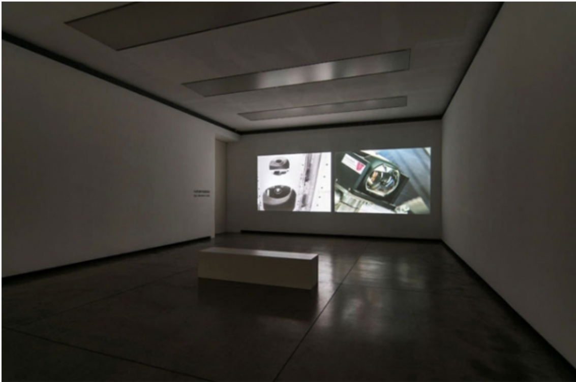
View installation at Fundación PROA (Buenos Aires), 2013