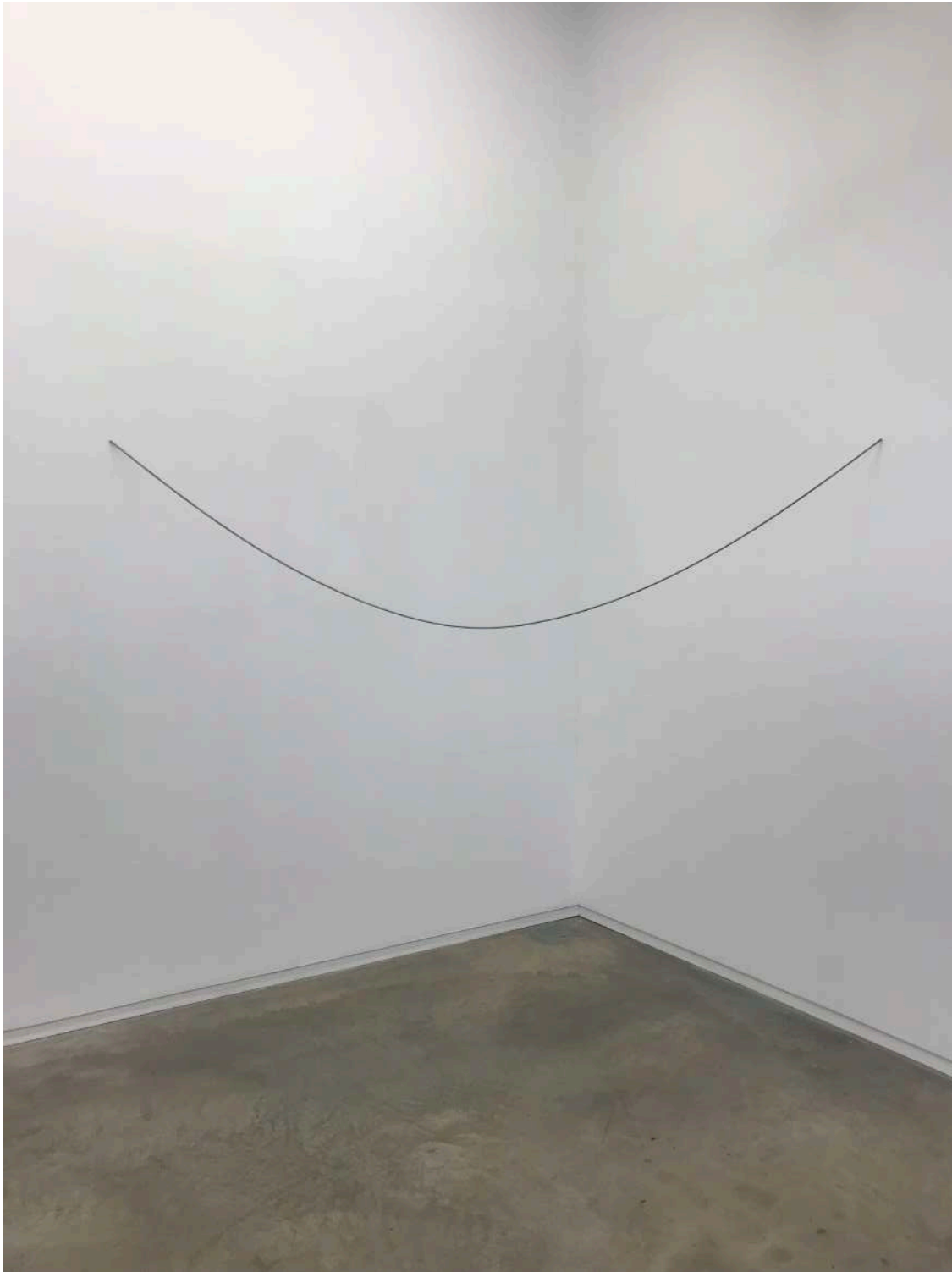
Fe en suspensión, 2019. Instalación |. Barra de hierro calibrado en suspensión. Installation. Calibrated iron bar 220 x 30 116 cm. Unique

Objetos y materiales descartados en el estudio. Encarnan fragmentos de ideas, frases a medias, formas potenciales. Las razones de su descarte son múltiples, y se extravían en el tiempo. Y sin embargo perviven, me acompañan, a veces durante décadas, estorbando, recordándome mi indolencia hacia ellos y también una particular deuda con los mismos, porque sin ellos el vacío se hace menos ponderable.