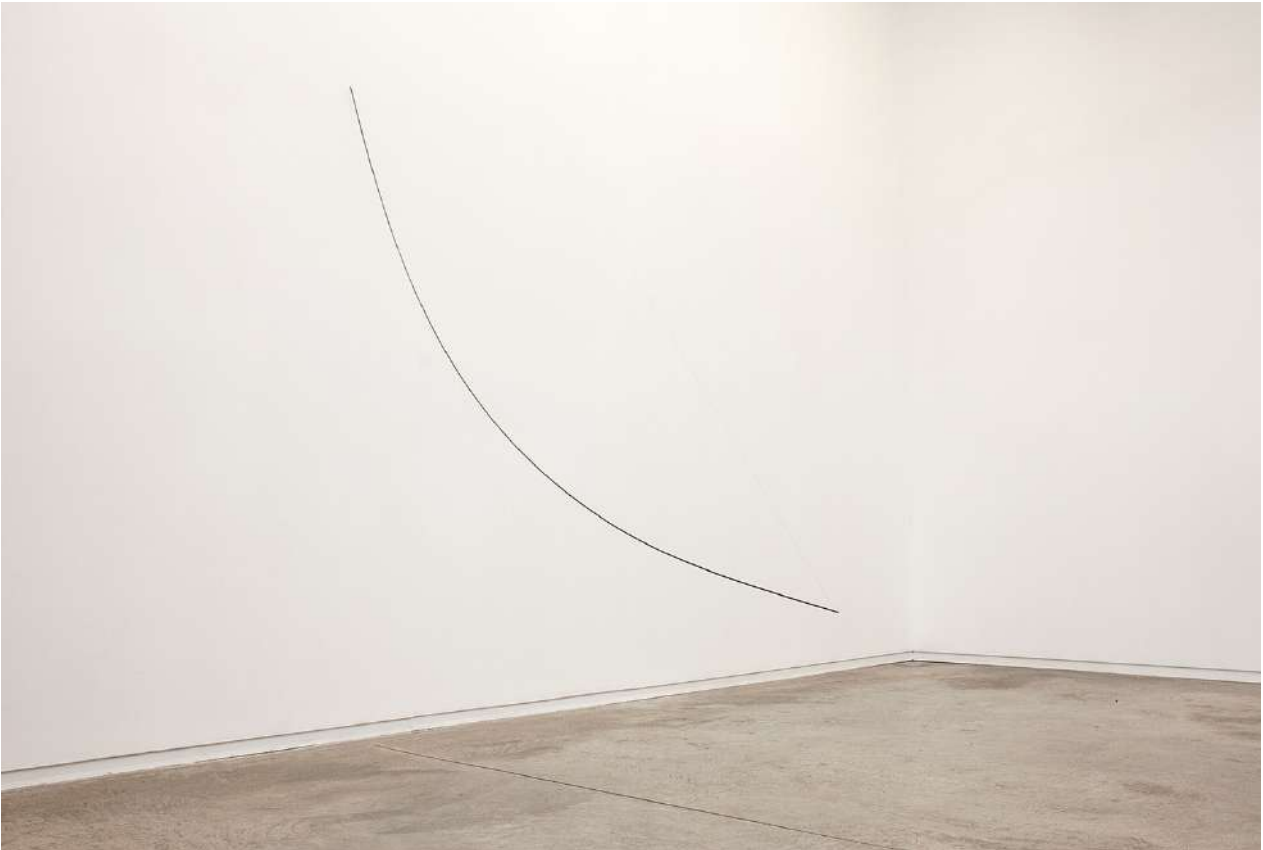
La línea del olvido, 2019. Barra de hierro de hilo de pesca calibrada | Calibrated iron bar fishing line. 120 x 177 cm

The title of Jaime Pitarch's fourth solo exhibition in àngels barcelona, De ser (To be), alludes to something that remains, a trace of the Spanish expression "dejar de ser", that in English translates as "to stop being"; but, if we don't pronounce the sentence entirely, it pre-draws a condition that fits with that of these objects and materials, their own possibility or their freedom "to be". By typing the two words that make up the title of the exhibition into a computer, the predictive mode of writing immediately suggests "To be possible", a latent possibility in language itself...as if everything that concerns being is plunged into uncertainty.