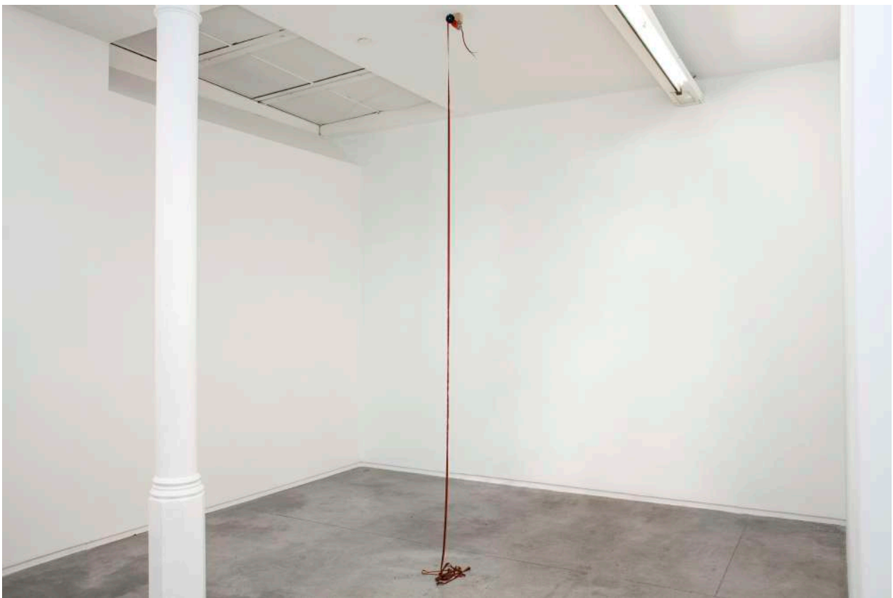
Los Olvidados, 2019. Cinta de máquina de escribir, motor, placa de Arduino con programación. Medidas variables | Mixed-media installation. Typewriter ribbon, Arduino plate with programming. Variable dimensions.

En definitiva, dejar de ser, o ser posible... Todo es posibilidad.