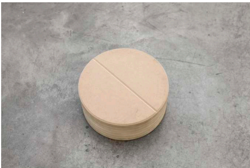
MDF/MFD", 2019. Escultura. Pieza de suelo. Tamaño equivalente al peso de la cabeza del artista. | Floor piece.Sculpture. DM Wood sculpture. Size of the weight of the artist's head. 30 cm Ø

And if the semantic play of an everyday item gives shapes the work MDF/MFD, with Clavo (Nail) (2019), that which is playful and words are mixed together in order to go unnoticed whilst being displayed on one of the walls of the gallery, in which the spice of smell instead of giving flavor has become a metallic object.