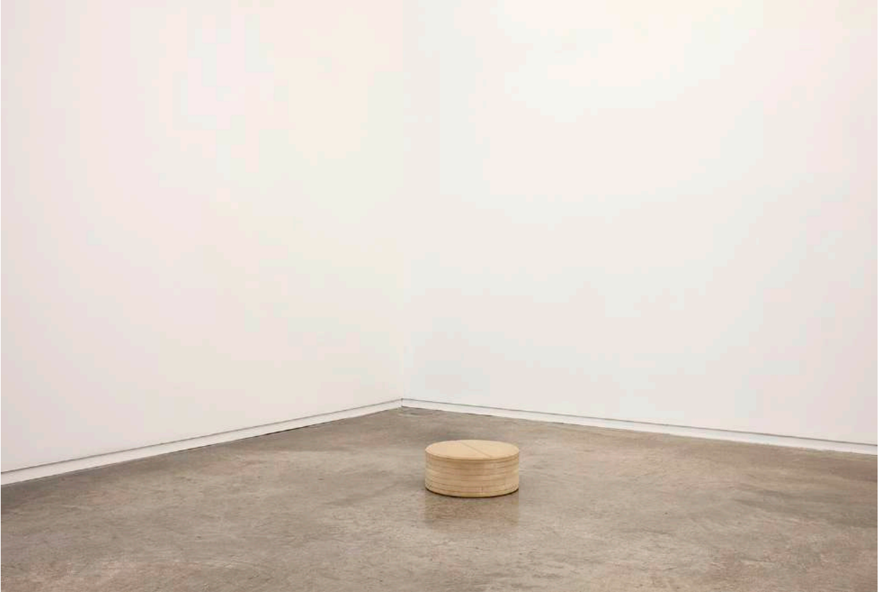
MDF/MFD", 2019. Escultura. Pieza de suelo. Tamaño equivalente al peso de la cabeza del artista. | Floor piece.Sculpture. DM Wood sculpture. Size of the weight of the artist's head. 30 cm Ø

La posición que ocupa en el espacio, Fe en suspensión (2019) no puede más que provocar una inmediata sensación de ineludible inestabilidad, como si la multiplicidad de los distintos puntos de vista que la obra nos concede en el espacio, coincidiera con las múltiples posibilidades que ésta tiene de desvanecerse cual posibilidad latente, como si la debilidad atendiera al espectador debidamente ubicada en la primera esquina del espacio expositivo. Fe en suspensión consiste en una varilla de 2,50 m de hierro calibrado en la que el peso de la misma parece indicar que, la simple flexión y apoyo en la pared no es suficiente para que esta se sostenga, pero contra todo pronóstico la barilla dibuja una curva que permanece "casi en suspensión". Como menciona Pitarch, la fe, es aquí un concepto en contradicción: por una parte, el conjunto de experiencias acumuladas (accidentes, conocimientos, experimentos etc.) hacen creer que la barra ha de caer. Esa fe a priori contrasta con aquella otra fe proyectada hacia la posibilidad de algo improbable. Fe es, no obstante, el símbolo del hierro. Quizás la pieza consiste únicamente en un hierro en suspensión. Dejando que la fe de cada espectador le mueva a interpretar las intenciones del artista en uno u otro sentido.