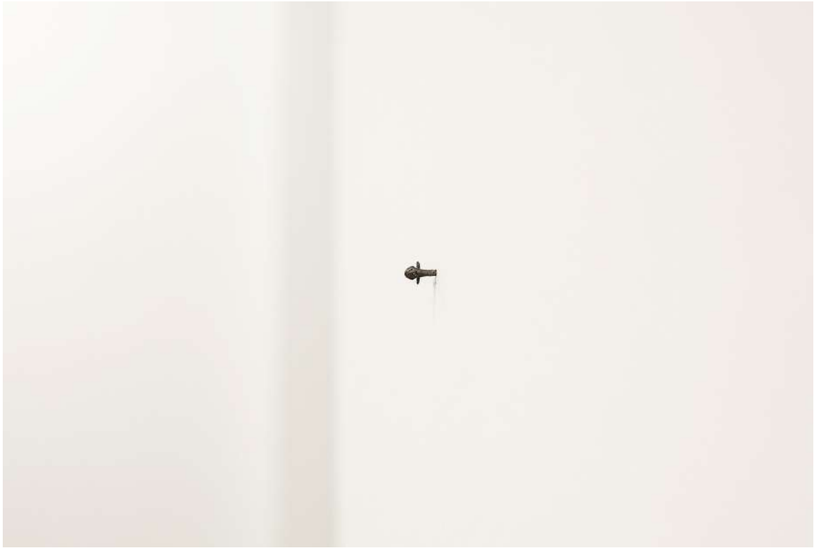
Clavo, 2019. Clavo metálico | Metallic clove. 1 x 1cm.

BIO | Jaime Pitarch vive y trabaja en Barcelona. En 1993 recibió una licenciatura en Bellas Artes por el Chelsea College of Art, Londres, y en 1995 obtuvo un Máster por el Royal College of Art de Londres.