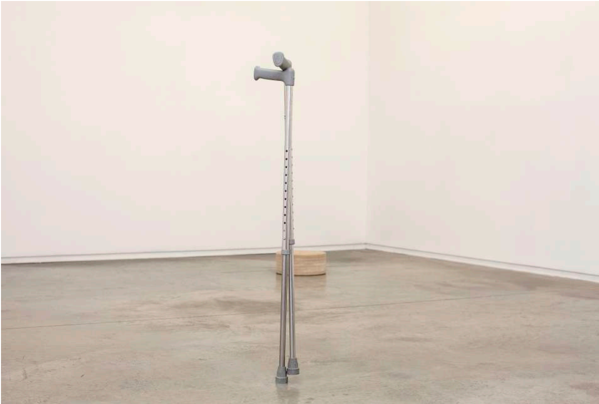
General exhibition view.

On the other hand, the acronyms that make up the title MDF/MFD (2019) refer to DM (the wood with which ceiling panels are produced to make furniture in carpentry and to tablets for the treatment of ADHD (Attention Deficit Disorder or Hyperactivity)), both being a by-product of a desire to make everything more feasible and operative, that is to say, to enable an increase in productivity. The DM block reproduces a tablet of the medicine that was prescribed to the artist, whose dimensions have been calculated according to the weight of his head, and thus materialize the rhythm marked by the asphyxiating contemporary solvency that we are not always able to maintain and that pharmacology is always willing to promote.