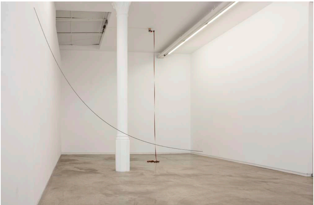
Detail. General view. Los Olvidados, 2019. Cinta de máquina de escribir, motor, placa de Arduino con programación. Medidas variables | Mixed-media installation. Typewriter ribbon, Arduino plate with programming. Variable dimensions.