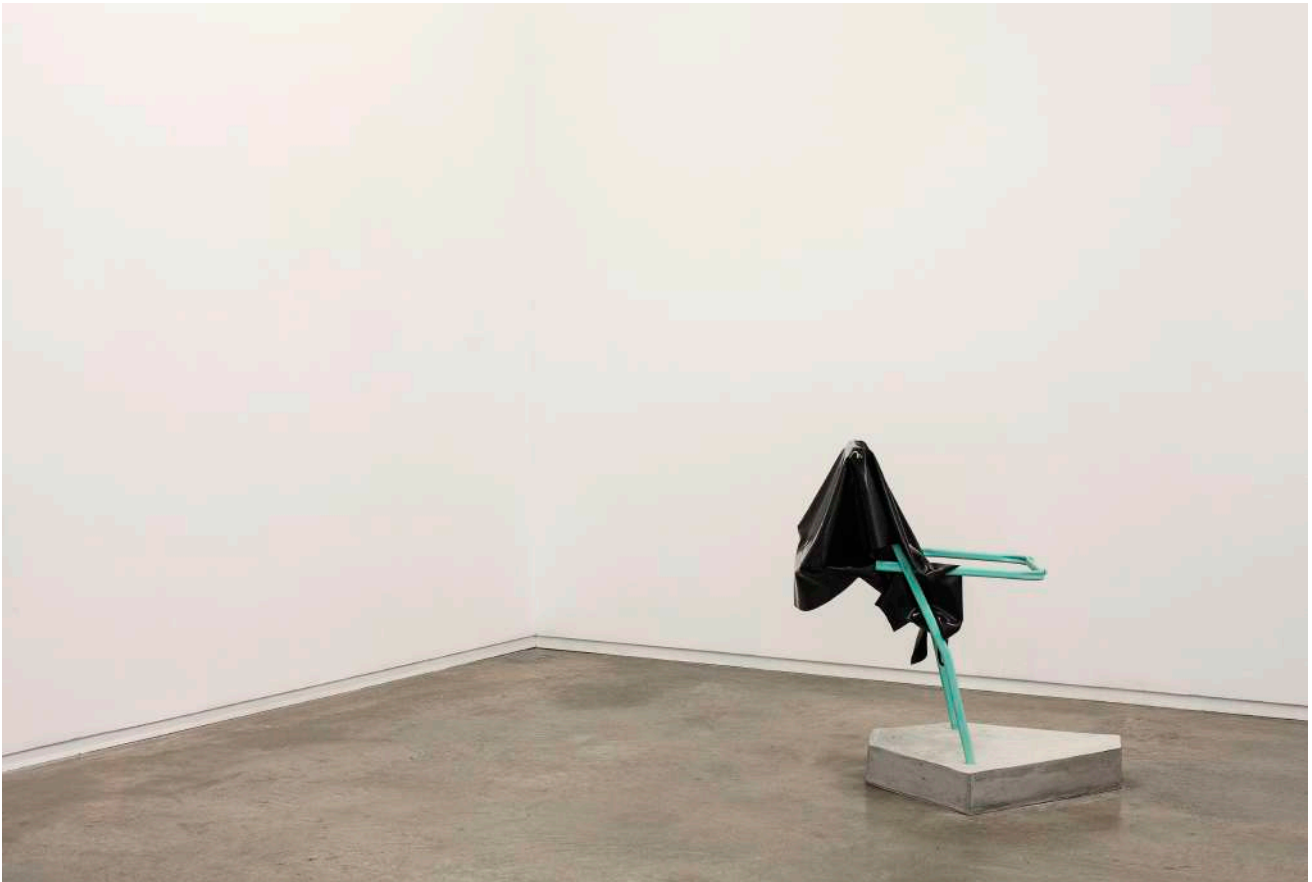
Untitled, (JEFF 4), 2014 Metal sculpture, latex, JEFF chair by Ikea cement and paint