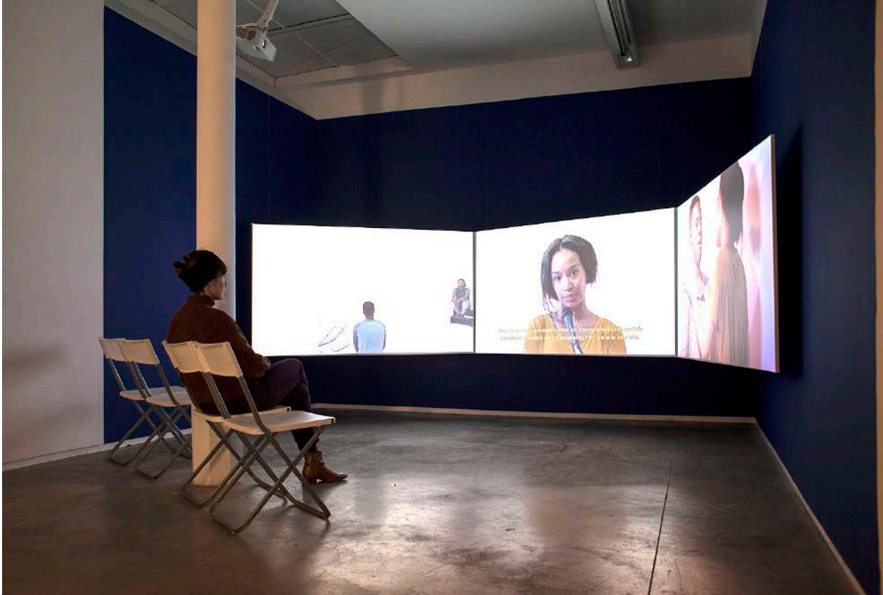
There is nothing to be scared of. They are crazy about each other , 2018. 3-channel Digital HD video installation 53' 11"

BIO - Itziar Barrio (Bilbao, 1976) lives and works in New York City. Her work has been presented in international venues such as the MACRO Museum (Rome), Participant INC (NYC), MACBA (Barcelona), Belgrade's Contemporary Art Museum (Serbia), Museo del Banco de la República, Bogotá (Colombia), Abrons Arts Center (NYC), Anthology Films Archives (NYC), Salzburger Kunstverein (Austria), Espacio ODEÓN, (Bogotá), Academy of Fine Arts in Gdansk (Poland), tranzit (Romania), European Network for Public Art Producers (ENPAP), ARTIUM (Vitoria-Gasteiz), and at the Havana Biennial among others.