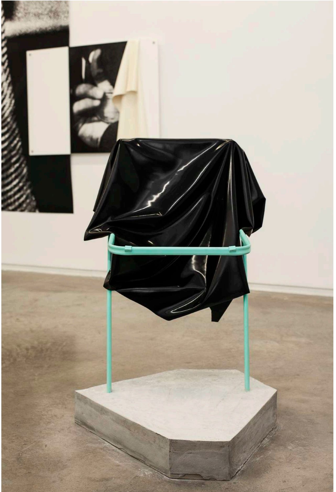
Untitled, (JEFF 4), 2014 Metal sculpture, latex, JEFF chair by Ikea cement and paint