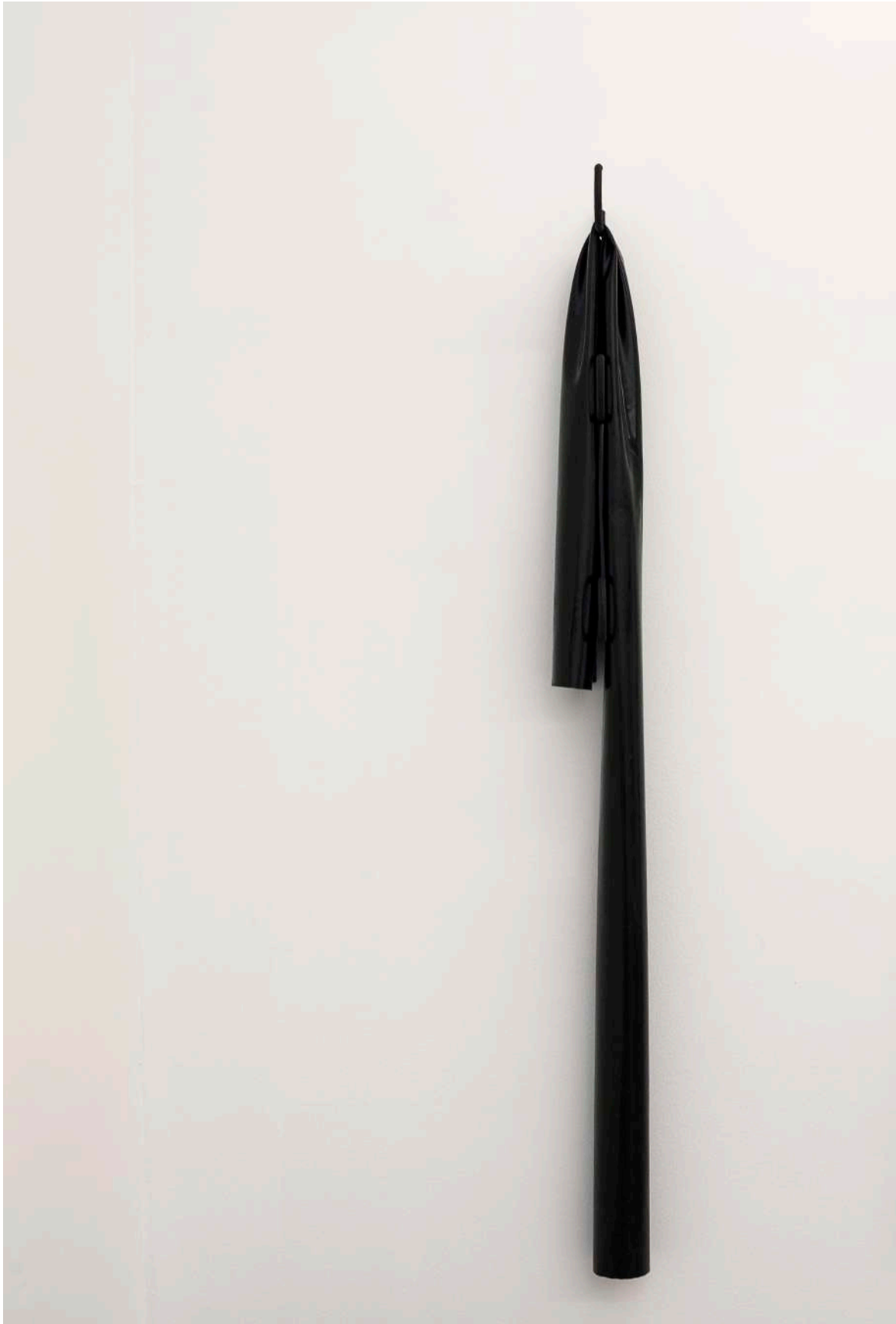
Detail. Pickpocket II , 2018. Inkjet, screen printing on plexiglass, concrete, latex and hooks. 180 x 25 cm.