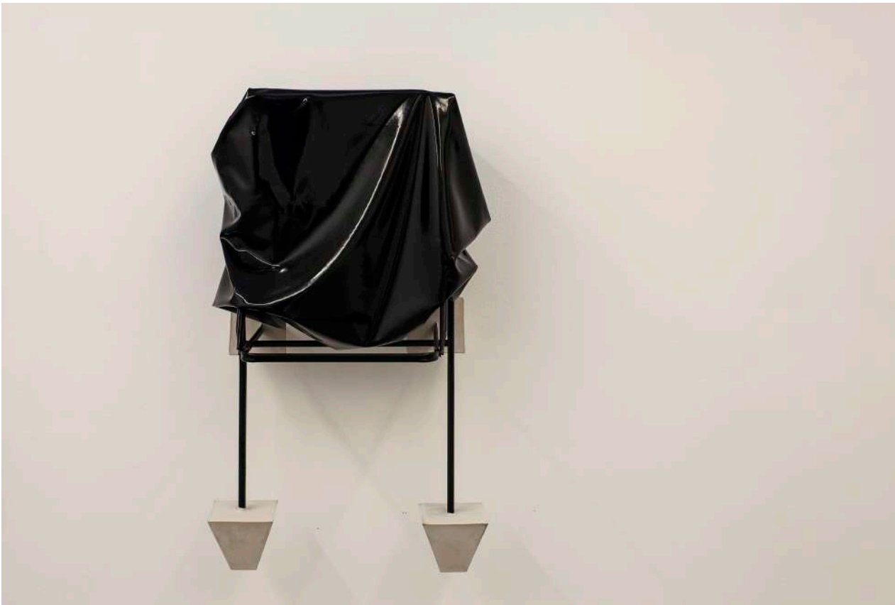
Nothing to be scared of. they are crazy about each other (Lightly bracing) , 2018 Metal sculpture, latex, Ikea JEFF chair, cement and paint 119,3 x 99 x 99 x 99 cm

Su interés por la tecnología de los cuerpos y los modos de producción, en sentido marxista, queda claro cuando se apropia de la silla JEFF para sus piezas escultóricas, una de las sillas más vendidas que Ikea ha producido hasta ahora. Una silla es un mueble que sirve para sentarse, poner nuestro cuerpo a descansar y, por lo tanto, es un objeto que moldea nuestros cuerpos; sin embargo, el significado en inglés de la palabra "silla" ( chair ) es también el de una persona a cargo de una estructura y, por lo tanto, semántica y materialmente, esta obra crea una asociación cargada de connotaciones de poder y del cuerpo, ese elemento que necesita ser moldeado para encajar . Al mismo tiempo, la combinación de materiales tan remotamente opuestos como el cemento (con las connotaciones que este puede tener, como la industria, el bajo coste, la clase obrera, etc.) y el látex (un material que se podría relacionar con la subcultura, con la dominación o con prácticas sexuales), Barrio opta romper los códigos que les son normalmente adjudicados.