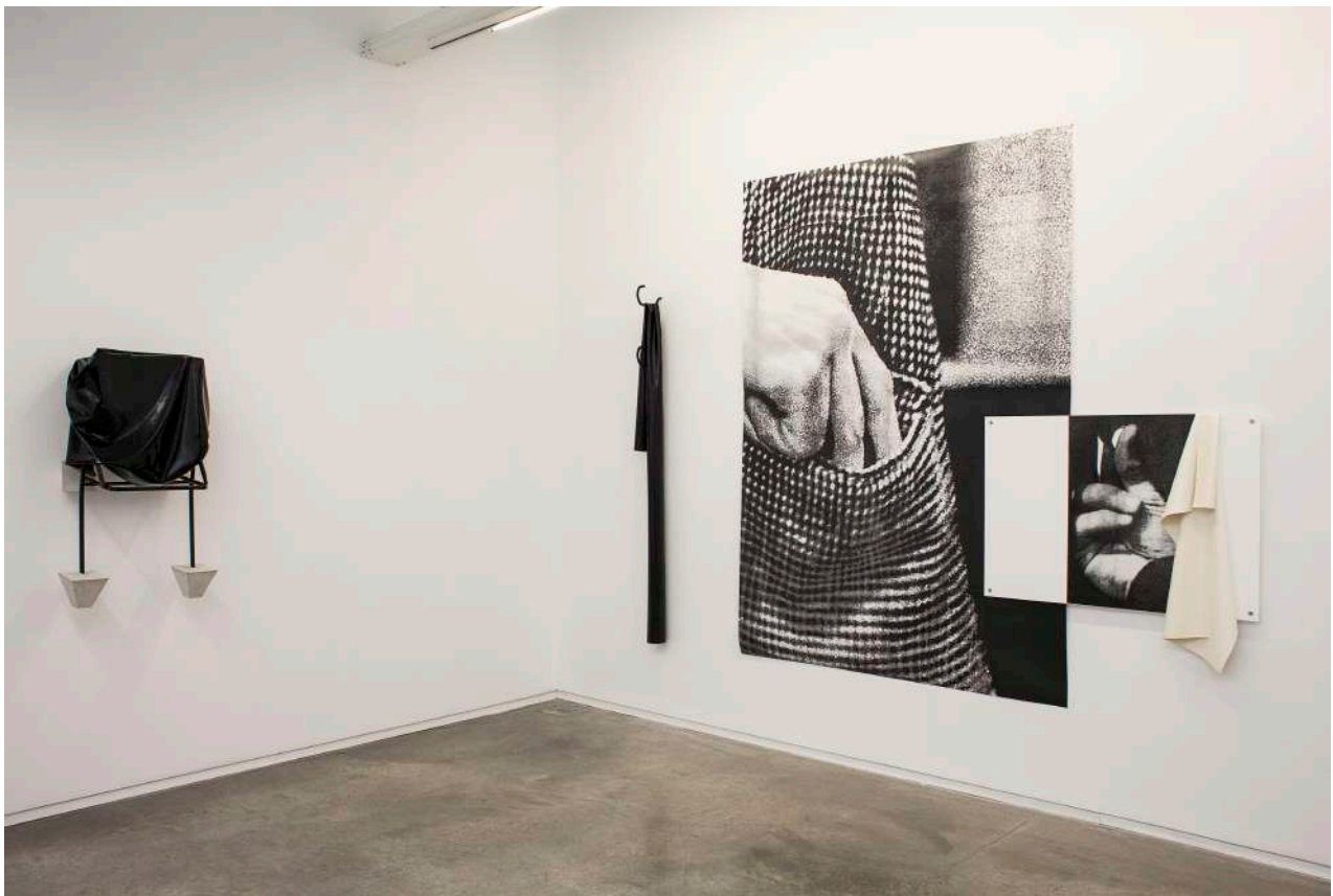
General exhibition view