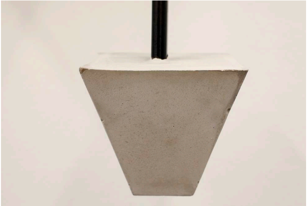
Detail. Nothing to be scared of. they are crazy about each other (Lightly bracing) , 2018 Metal sculpture, latex, Ikea JEFF chair, cement and paint 119,3 x 99 x 99 x 99 cm