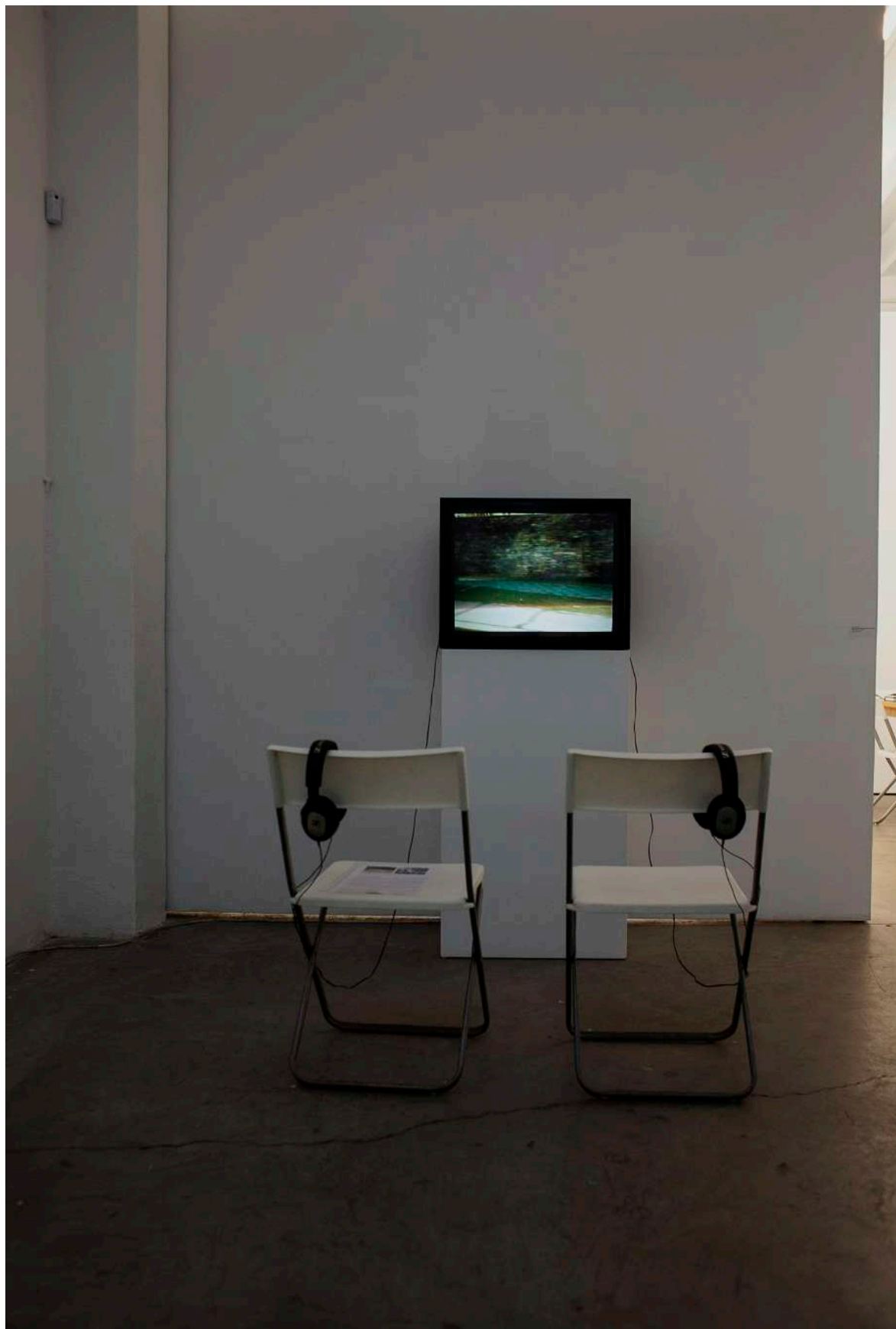
Harun Farocki, "Remember Tomorrow is the First Day of the Rest of Your Life" , 1972. Video, color, sound, 10'