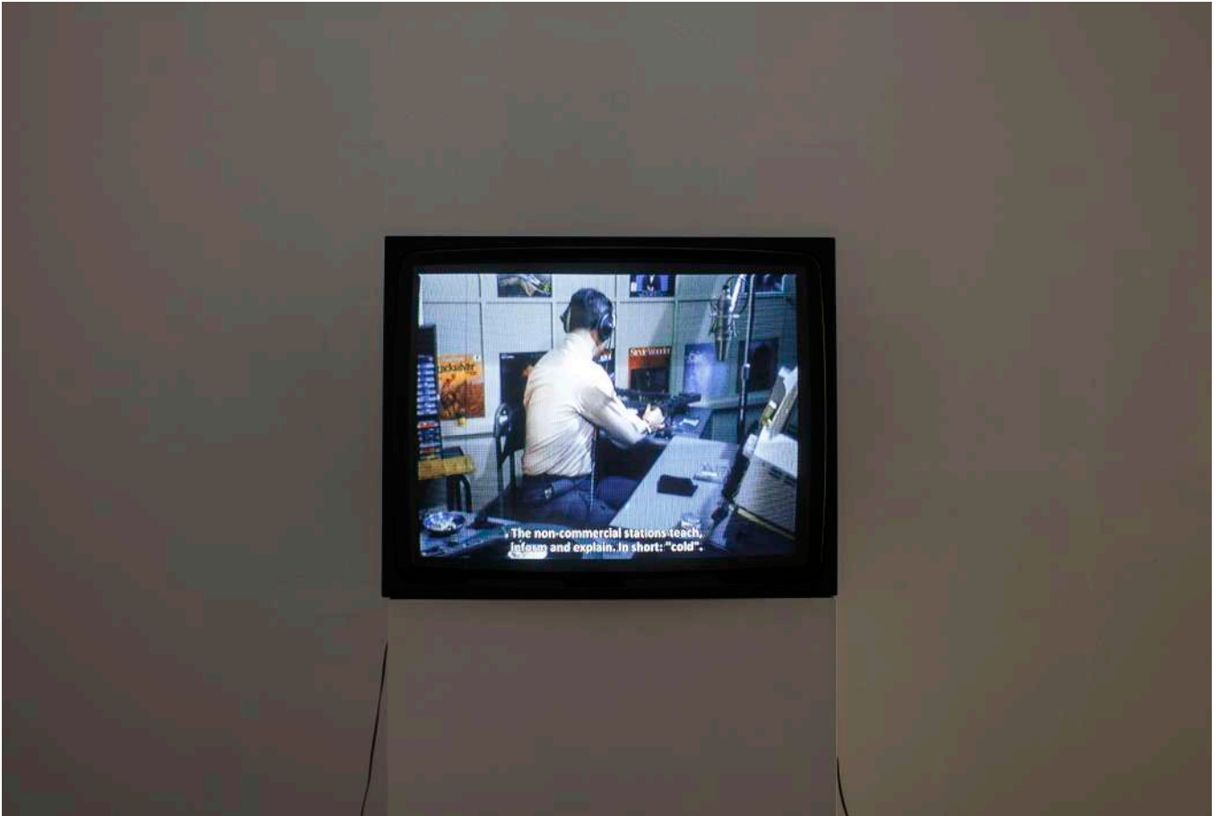
Harun Farocki, "Remember Tomorrow is the First Day of the Rest of Your Life", 1972. Video, color, sonido, 10'