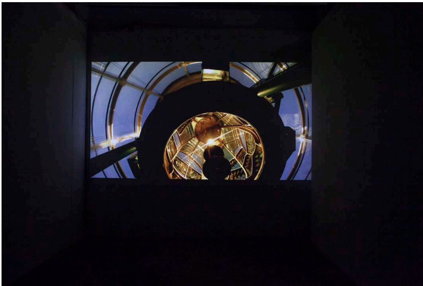
Carlos Casas , Faro , 2019. Vídeo, color, sonido, 20'.