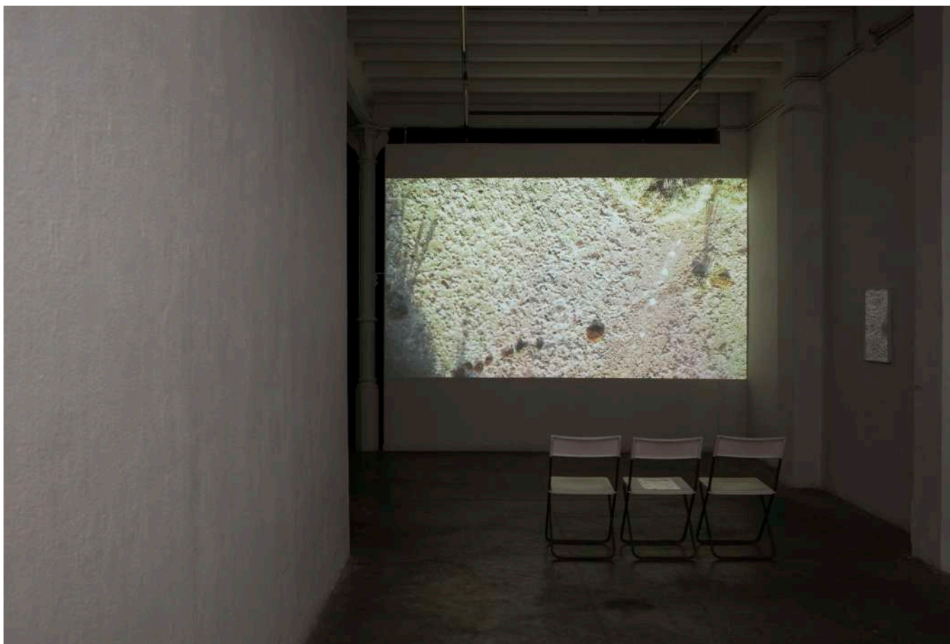
Daniel G. Andújar, Campo de concentración de Albaterra , 2019. Vídeo, color, sonido, 9'47''.

Carlos Casas es un cineasta y artista cuya práctica artística engloba el cine, el sonido y las artes visuales. Sus películas han sido proyectadas y premiadas en festivales de todo el mundo, tales como el Festival de Cine de Venecia, el Festival Internacional de Cine de Rotterdam, el Festival Internacional de Cine de Buenos Aires, el Festival Internacional de Cine de México, el FID de Marsella, etc. Su trabajo ha sido exhibido e interpretado en instituciones y galerías de arte internacionales, como la Tate Modern, Londres, la Fondation Cartier, el Palais de Tokyo, el Centre Pompidou, París, el Hangar Bicocca, Milán, el CCCB de Barcelona, el GAM de Torino, y el Bozar de Bruselas, entre otras.