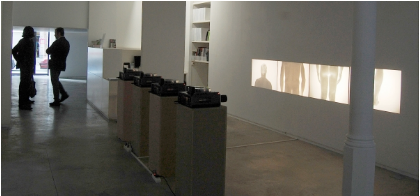
View installation, 4 slide projectors + 320 black and white analogue

4 slide projectors + 320 black and white analogue analogue negative. Ed. 3