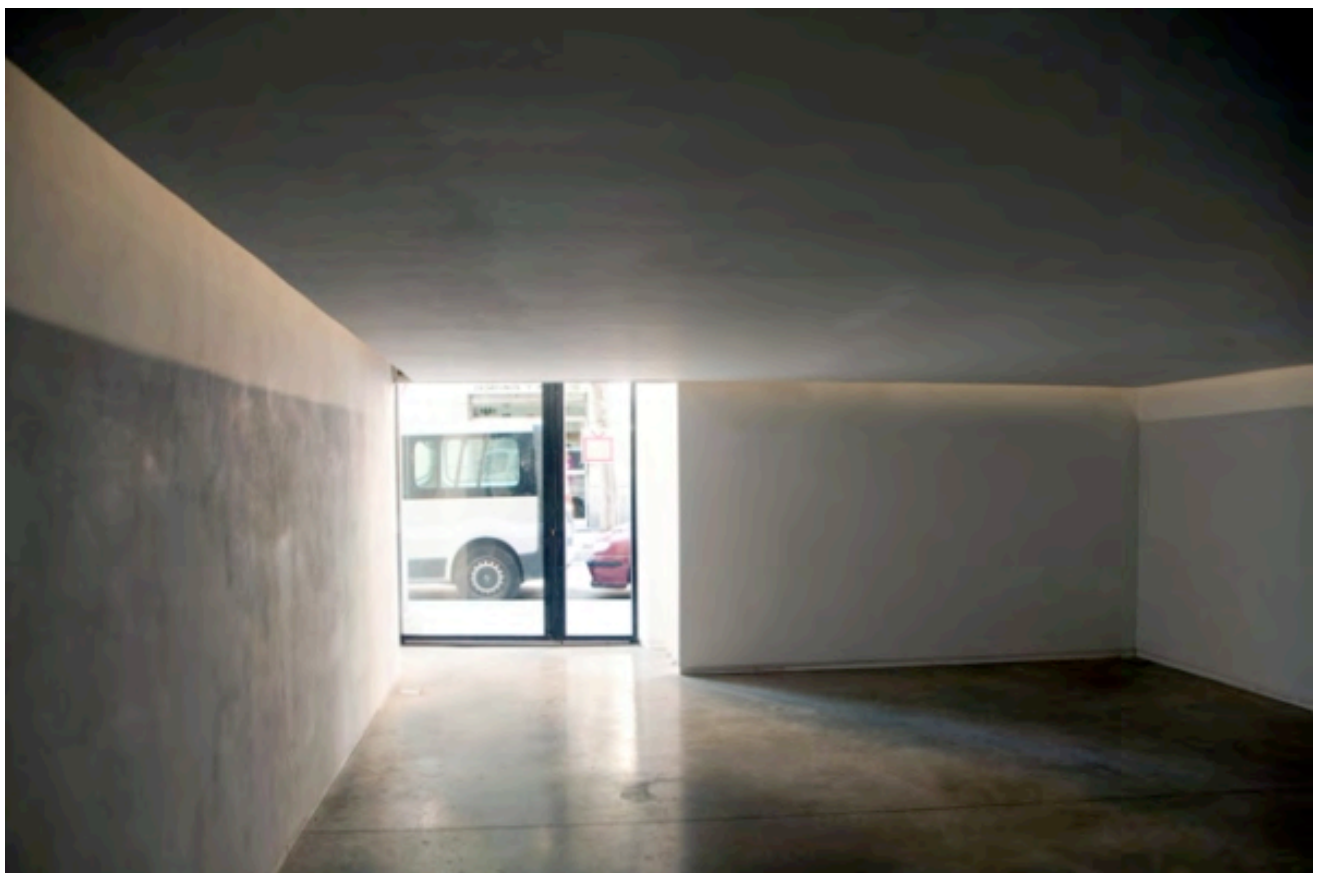
View installation, Drop ceiling of 1,80cm + double sound track, Ed. 3