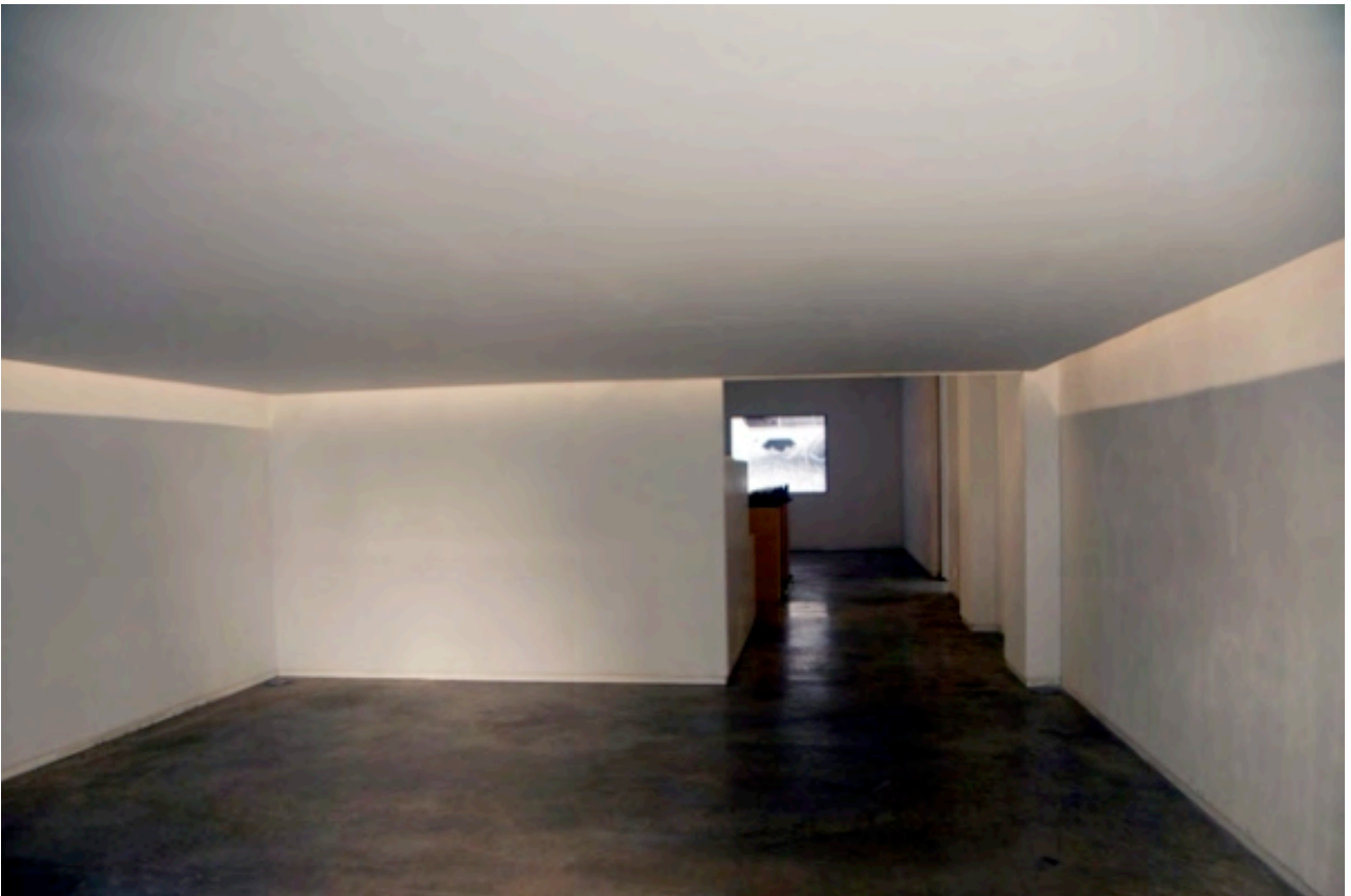
View installation, Drop ceiling of 1,80cm + double sound track, Ed. 3