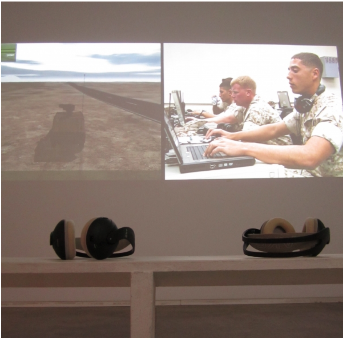
Installation view at àngels barcelona. Serious Games I: Watson is Down , 2010