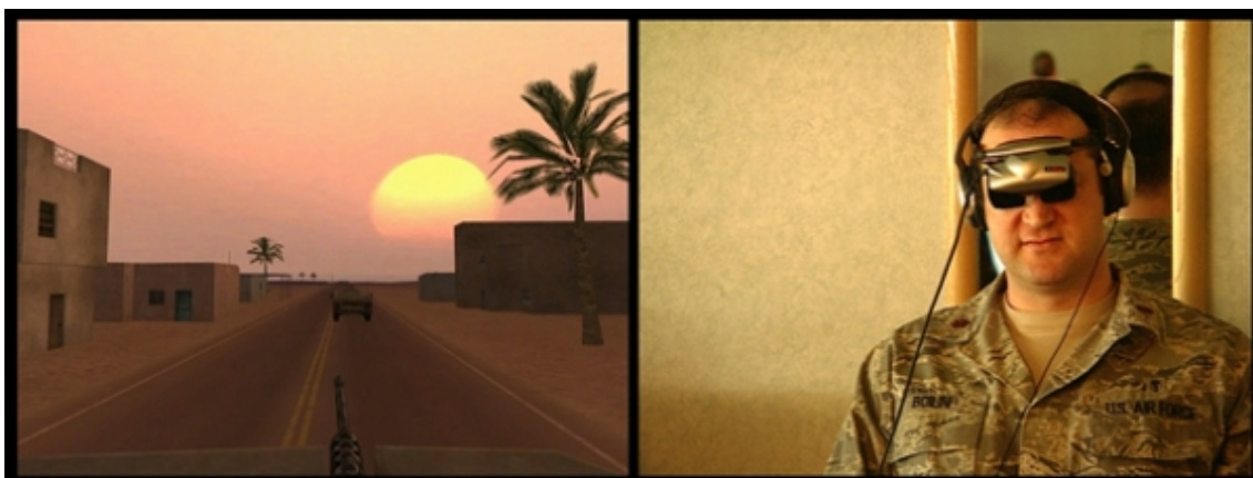
Video still, Serious games III: Immersion , 2009