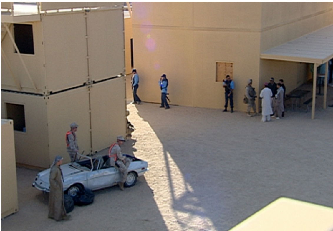
Video still, Serious games II: Three Dead , 2010