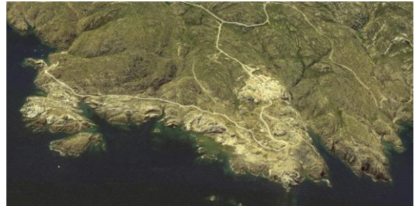
Paratge de Tudela (Girona) antes y después del proceso de re-naturalización.

El Club Med se edificó durante el boom inmobiliario de los años 60 y abrió sus puertas ocupando una superficie de 240 ha. con capacidad para 1.200 visitantes. El resort incluía dos restaurantes, bar, piscina, pistas deportivas, un pequeño teatro, discoteca, un pequeño puerto privado y un gran número de bungalós para albergar a los turistas. En 1997 el Cap de Creus fue declarado Parque Natural pero este espacio mantuvo su actividad hotelera hasta 2004, como una pequeña isla urbana dentro de un entorno natural protegido. Con el cierre se inició un dilatado proceso de recuperación natural cuya intervención más representativa consistió en la demolición y vaciado de las construcciones existentes. Un gesto de enorme valor simbólico y formal que se acompaña de un conjunto de medidas e intervenciones menos visibles pero igual de importantes dentro del proceso de restauración, tanto en un sentido paisajístico como ecológico.