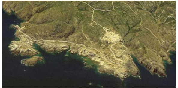
Paratge de Tudela (Girona) abans i després del procés de re-naturalització.