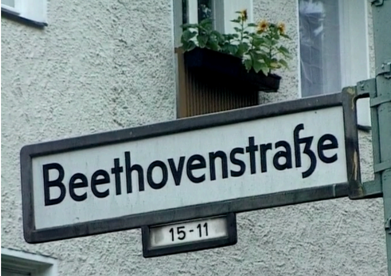
Harun Farocki (Novy Jicin, 1944-Berlin, 2014)