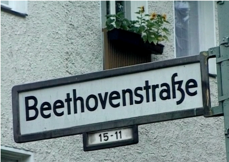
Harun Farocki (Novy Jicin, 1944-Berlin, 2014)