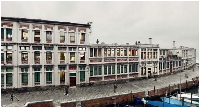
Superior izquierda: 180º. Imagen 0. fotografía color, 150 x 284 cm.

Presentamos la segunda fase del proyecto, en el que la imagen técnica explota en fragmentos, alejándose de su origen y convirtiéndose en metáfora de la imposibilidad de control de la imagen. Cada fragmento genera así nuevas micro narraciones.