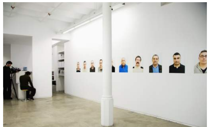
Vista exposición Inversión , 2012 Galería àngels barcelona

Sus trabajos pretenden crear, sin complacencias, un espacio de tensión que explore las concepciones de raza, clase y nacionalidad mostrando el funcionamiento social como una estructura basada en la inclusión y la exclusión.