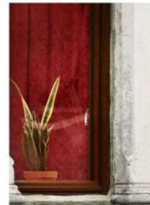
180º, Fragmento 68, Fotografía Color Giclé, 30 x 24 cm Ed. 1/3

Mabel Palacín ha mostrado su trabajo en la Bienal de Venecia (Pabellón de Cataluña y Baleares), Salvador Dalí Museum St. Petersburg (Florida), Museu Coleção Berardo (Lisboa), Museu Empordà (Figueres) Casino Luxembourg Forum d' Art Contemporain (Luxemburgo), MACBA (Barcelona), Museo Patio Herreriano (Valladolid), Künstlerhaus Palais Thurn und Taxis (Bregenz), Reykjavik Art Museum, Kunstbunker Tumulka (München), Kwangju Biennale, Norwich Gallery, Norwich. Centre d'Art Santa Mònica (Barcelona), MUA (Alicante) y ARTIUM (Vitoria), entre otros.