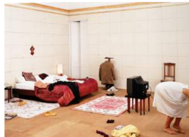
Habitaciones Exactas , 1989 Fotografía en color montadas en metacrilato y enmarcadas 100 x 150 cm (c/u)

Pep Agut ha mostrado sus trabajos individual y colectivamente en grandes eventos como la Bienal de Venecia, Bienal de Sidney o Prospekt, y también en museos como el Tel Aviv Museum of Contemporary Art o el MACBA Museu d'Art Contemporani de Barcelona, entre otros. Ha coordinado y participado en seminarios, conferencias y debates sobre arte y su trabajo está representado en destacadas colecciones particulares y públicas.