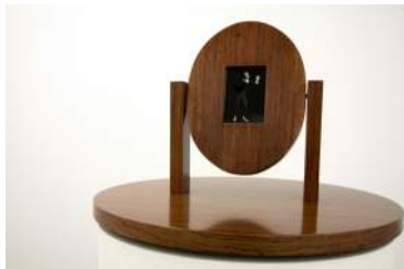
Rescue attemp. Nonsense (Tentativa de salvación. Absurdo) , 1994 Madera, fotos en blanco y negro, cristal, peana cilíndrica y plataforma giratoria. 173 (altura) x 63 (diámetro) cm