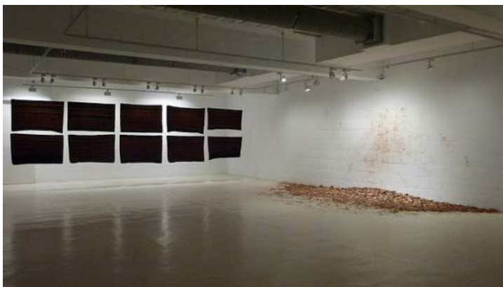
Vista exposición Recursos Humanos , 2011 Espai 13. Fundació Joan Miró, Barcelona