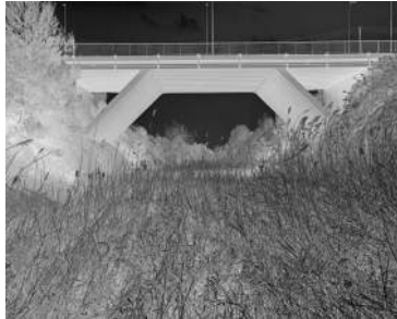
Sinapsis , 2011 Caja de luz de leds con Duratrans. 120 x 150 cm Ed 3

Obras históricas de los 80 y de los 90 en diálogo con la pieza central de su última exposición en la galería