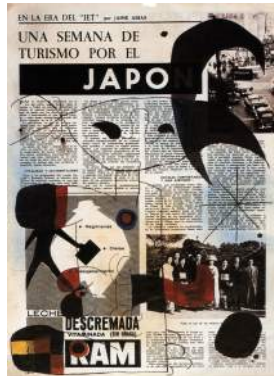
El país del sol naciente, 1962-63

Collage y gouache sobre gelatina de plata 60 x 50 cm. (Ejemplar único)