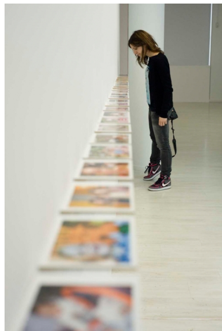
97 empleadas domésticas (97 house maids) , 2010

Vista exposición / Exhibition view: Casa de la Mujer, Sala de exposiciones Juana Francés, Zaragoza