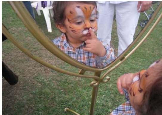
97 empleadas domésticas (97 house maids) , 2010. Imágenes / Images: 10 x 15 cm