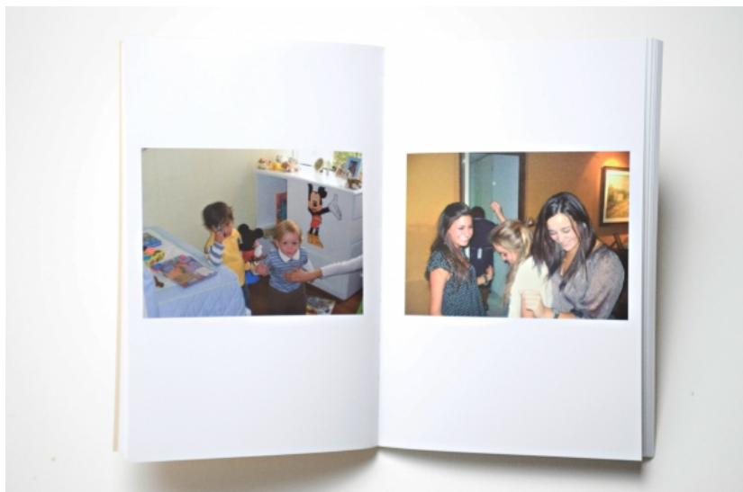
97 empleadas domésticas (97 house maids) , 2010 Publicación/Publication: 13 x 20 cm