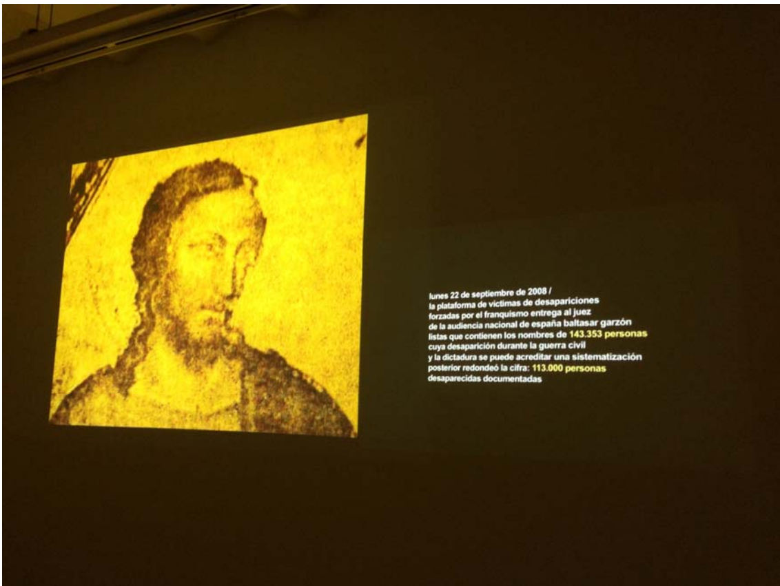
143.353 (los ojos no quieren estar siempre cerrados / (the eyes do not want to be always shut), 2010 Instalación de dos canales de video / Two-channel video installation: 45 min. + 27 min.