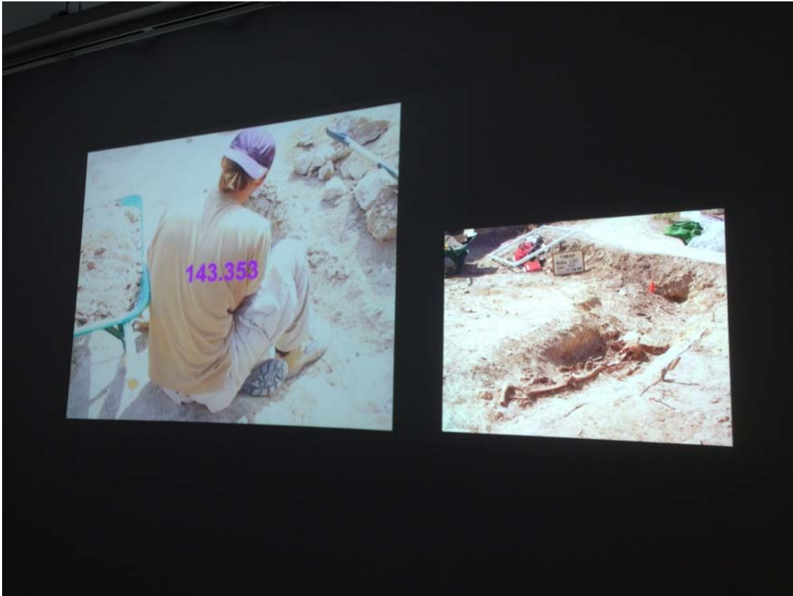
143.353 (los ojos no quieren estar siempre cerrados / (the eyes do not want to be always shut), 2010 Instalación de dos canales de video / Two-channel video installation: 45 min. + 27 min.