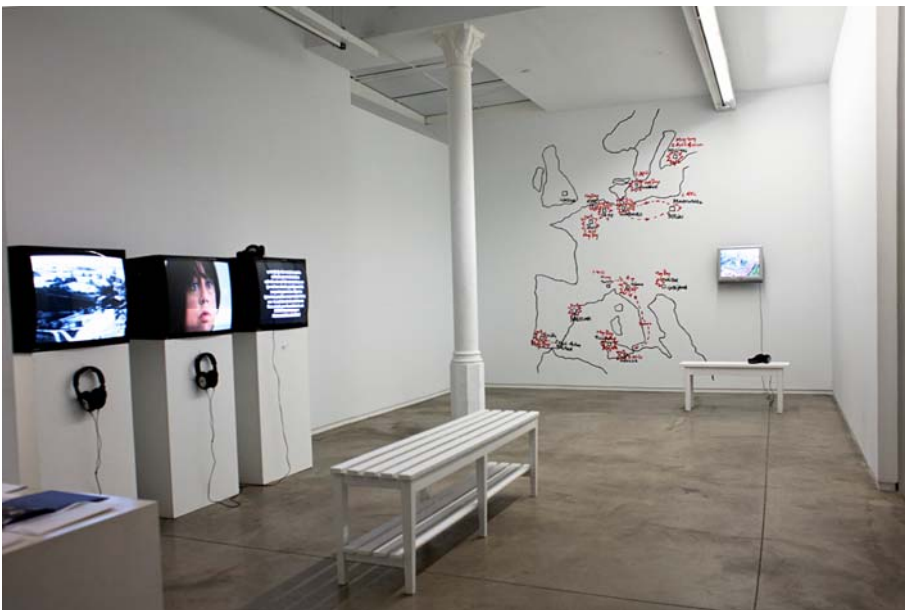
Vistas exposición / Exhibition views: Marcelo Expósito, àngels barceona, 2013.

La exposición de Marcelo Expósito en àngels barcelona gira en torno a dos problemáticas actuales: la memoria histórica y las transformaciones de las metrópolis en la globalización. Estas temáticas se concentran respectivamente en cada uno de los dos espacios de la sala de exposiciones, que albergan en total tres instalaciones de vídeo. La muestra en su totalidad (la sala de exposiciones más un programa de proyecciones en la sala minicinema) constituye una síntesis de líneas temáticas, imagerías y procedimientos que se han ido articulando en un trayecto de más de dos décadas, a través de una labor siempre entrelazada con diversas redes para pensar y agrupamientos para producir en colaboración.