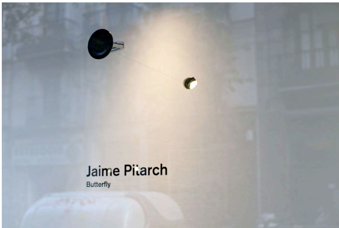
Exhibition view, àngels barcelona, 2013.

Butterfly , the installation by Jaime Pitarch (Barcelona, 1963) at àngels barcelona , is an action, achieved through the use of simple elements that are arranged in a subtle and nearly unnoticeable way, that questions the spectacular side of art. In this piece we find the usual distinctive elements of Pitarch's work: the poetics of the everyday, humor, playfulness, tension and precariousness. As part of the program of exhibitions of the gallery, this show fits as a new reading of historical works, a setback and thus as a way out from the usual dynamics of presenting the new.