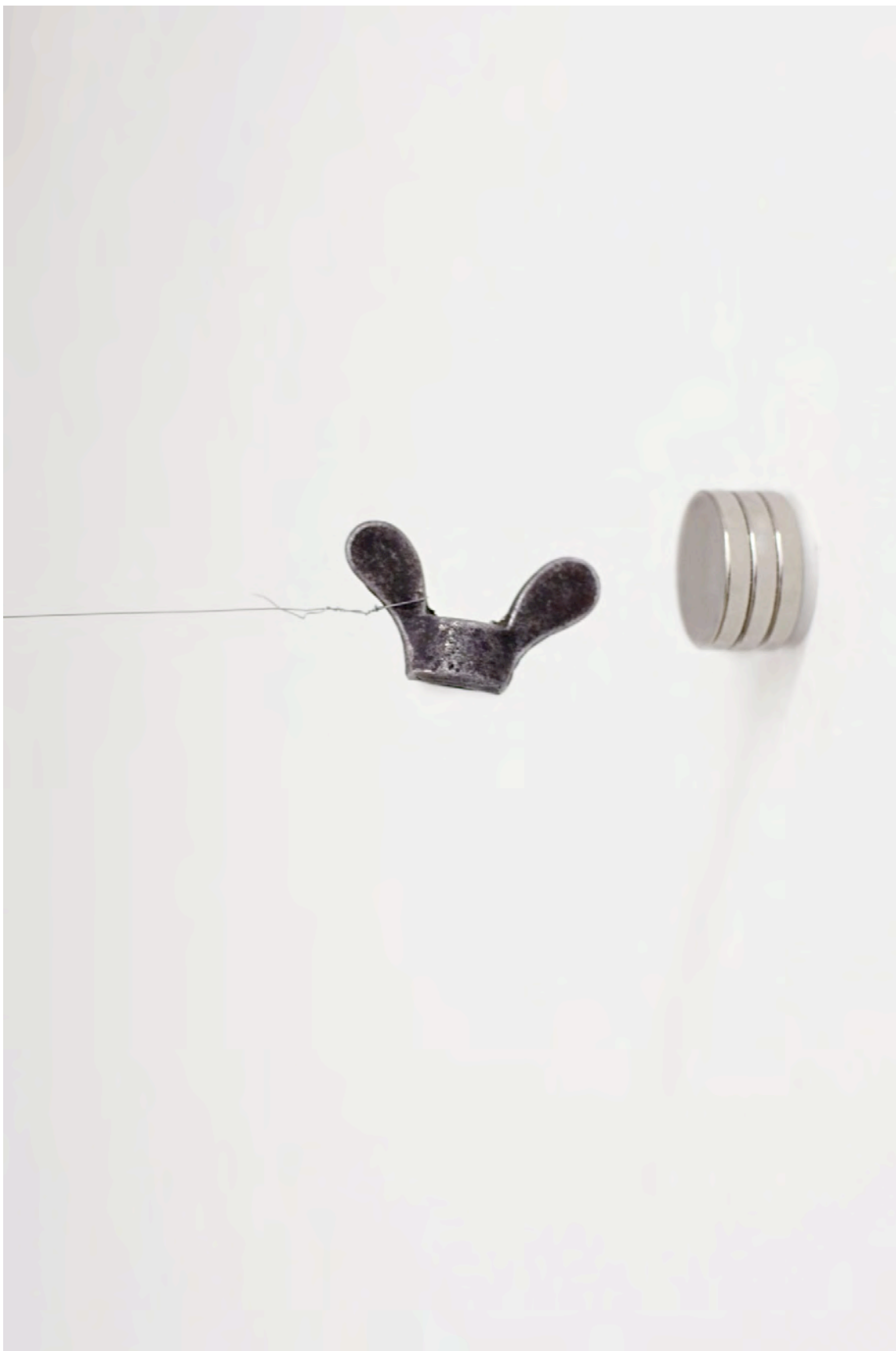
Vista exposición / Exhibition view:, àngels barcelona, 2013