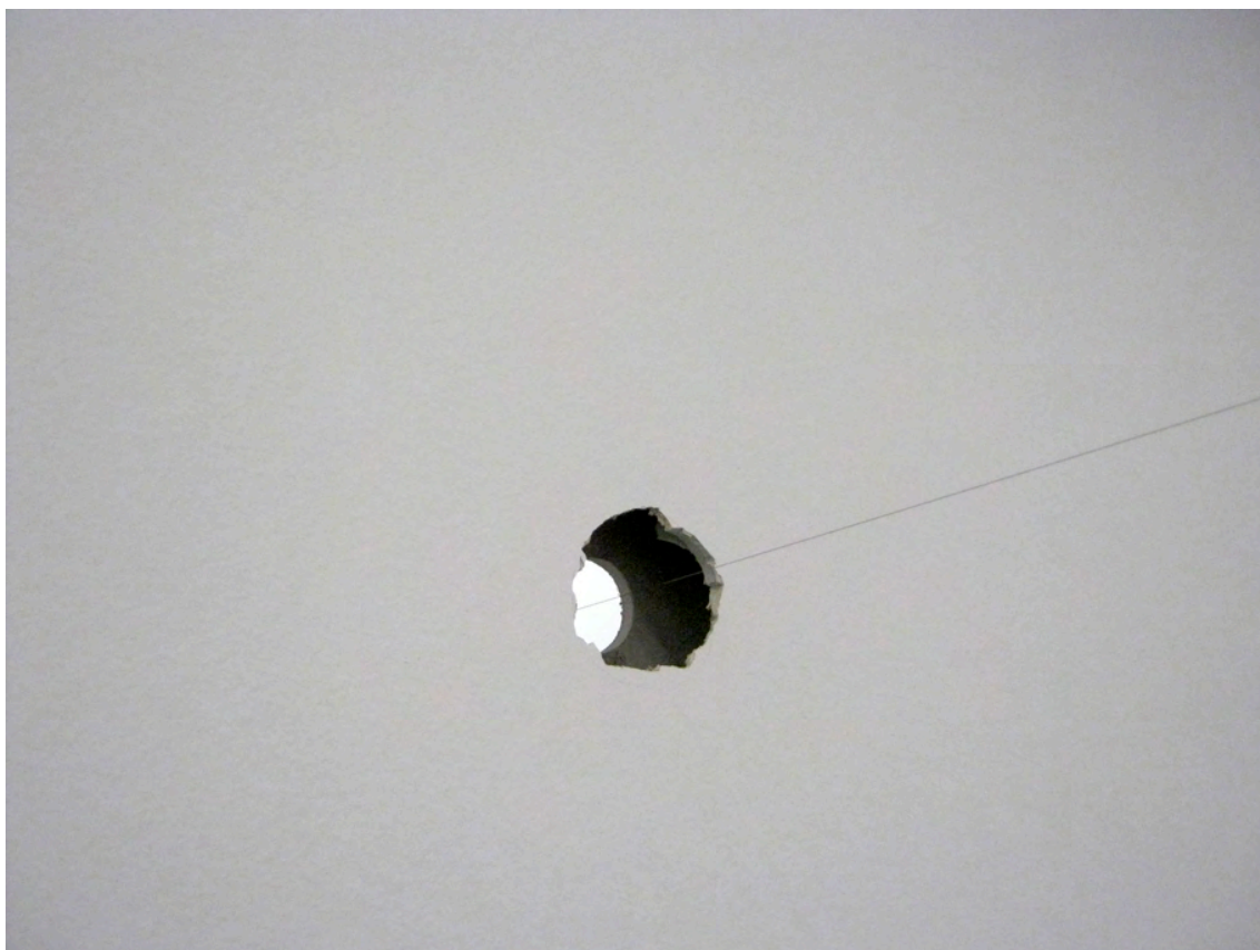
Vista exposición / Exhibition view, àngels barcelona, 2013