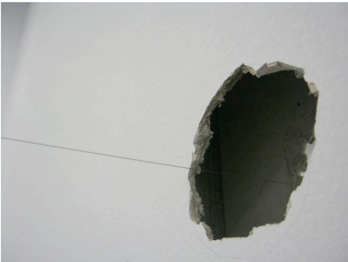
Vista exposición / Exhibition view, àngels barcelona, 2013