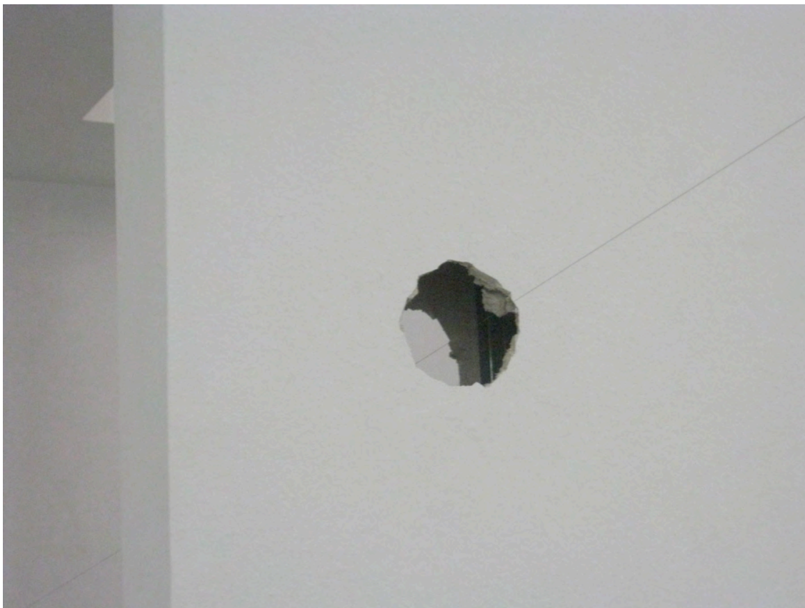
Vista exposición / Exhibition view, àngels barcelona, 2013.