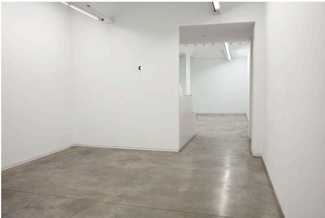
Vista exposición / Exhibition view, àngels barcelona, 2013.